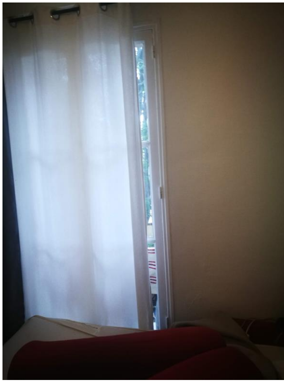
Parquet flottant au sol