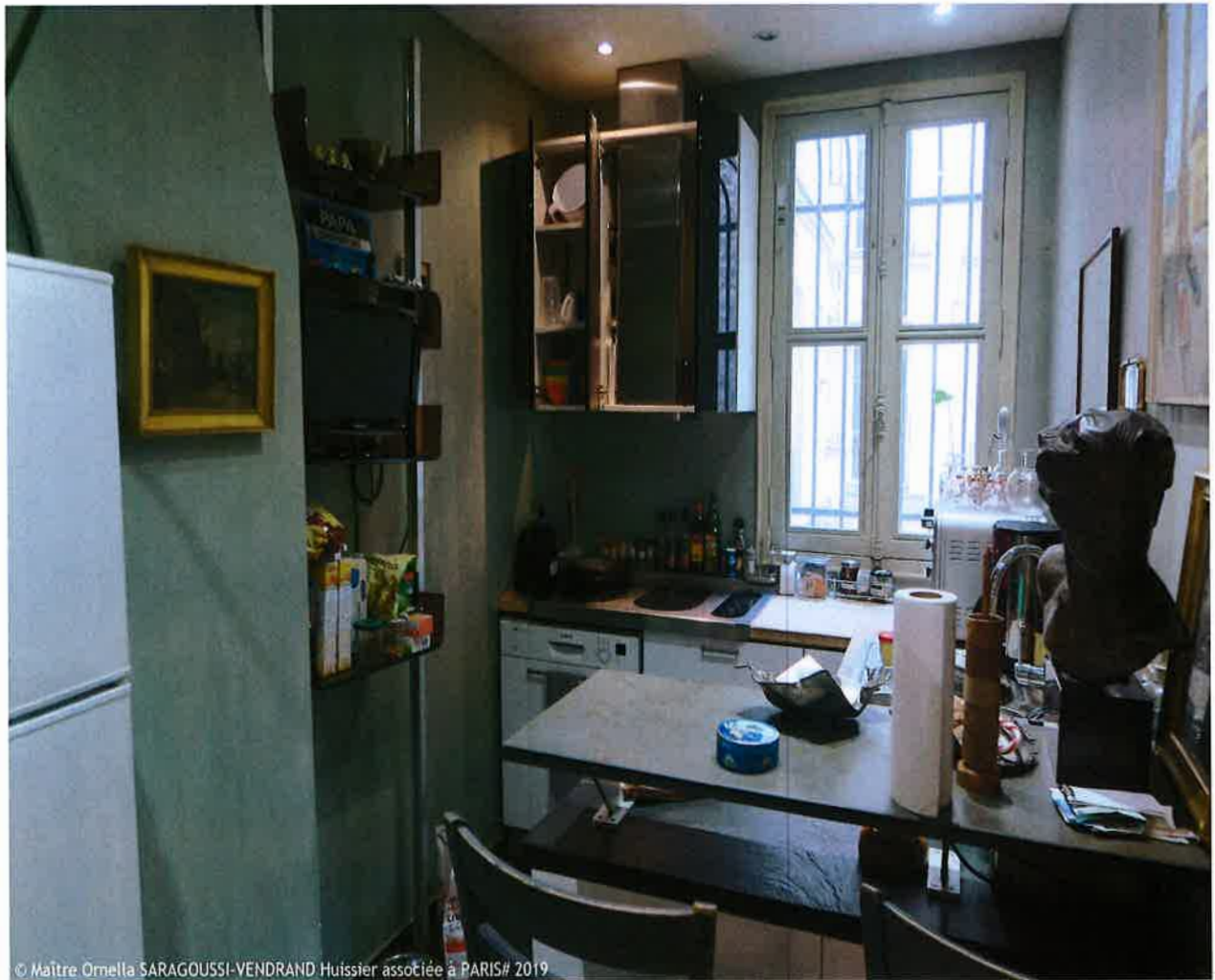
© Maître Ornella SARAGOUSSI-VENDRAND Huissier associée à PARIS# 2019