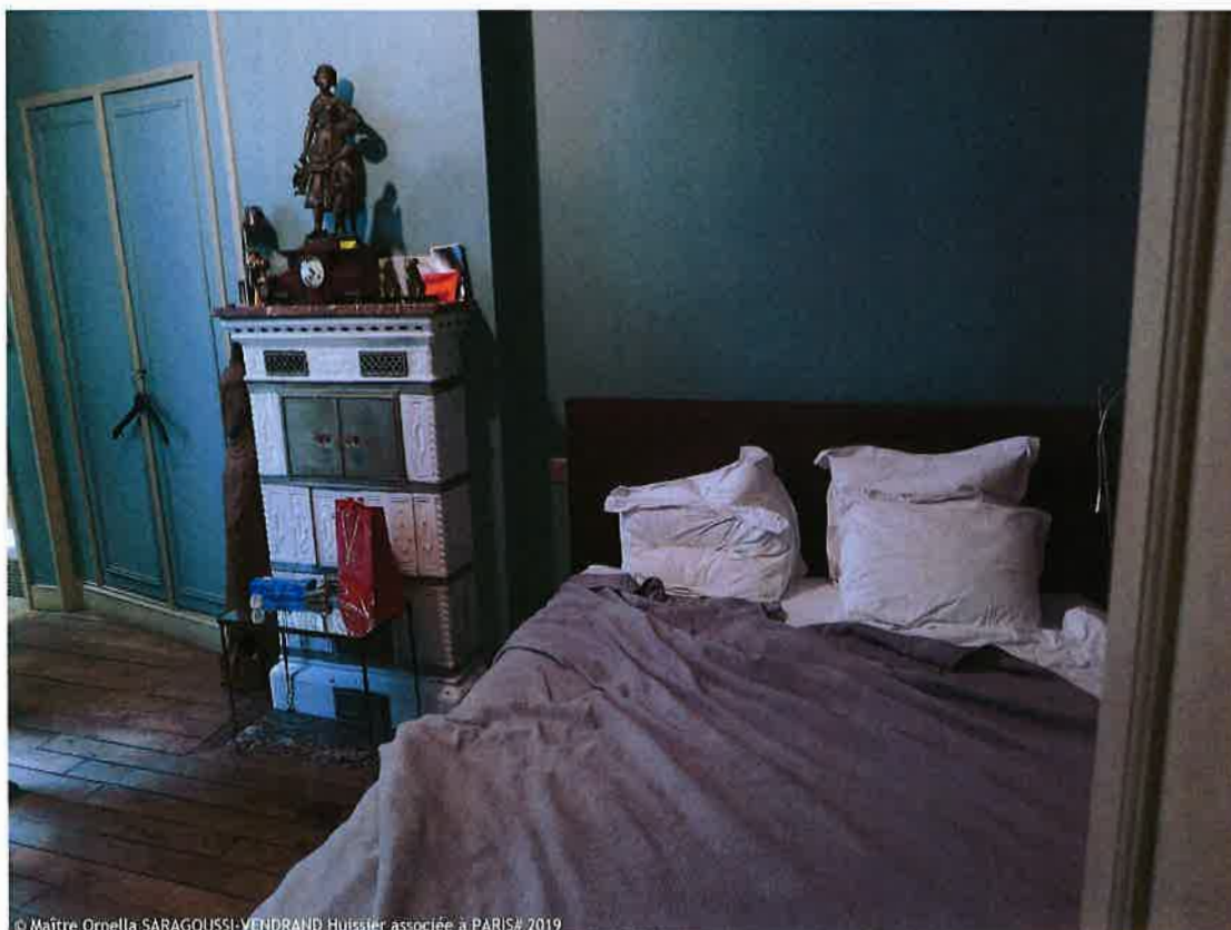
© Maître Ornella SARAGOUSSI-VENDRAND Huissier associée à PARIS# 2019