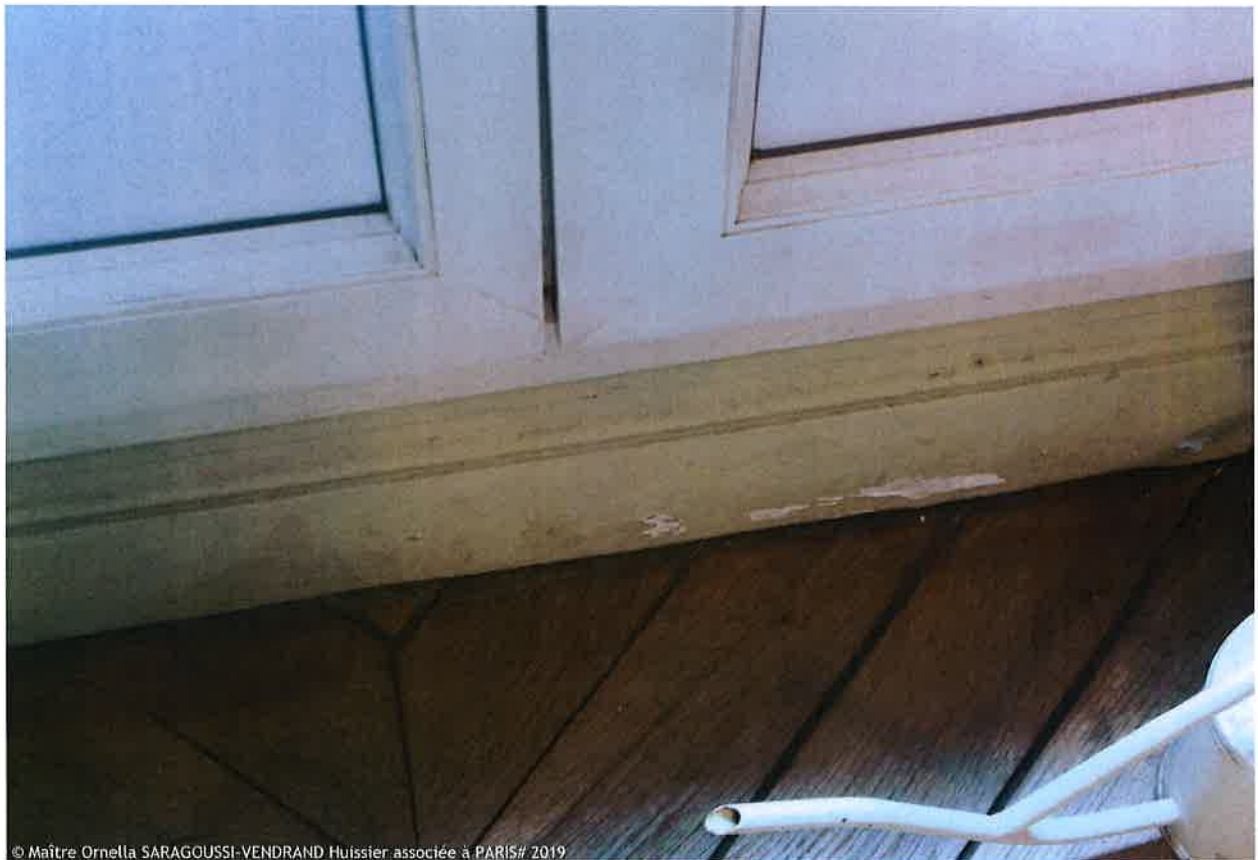
© Maître Ornella SARAGOUSSI-VENDRAND Huissier associée à PARIS# 2019