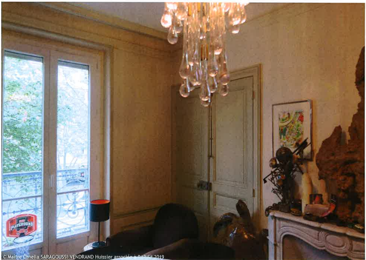
© Maître Ornella SARAGOUSSI-VENDRAND Huissier associée à PARIS# 2019