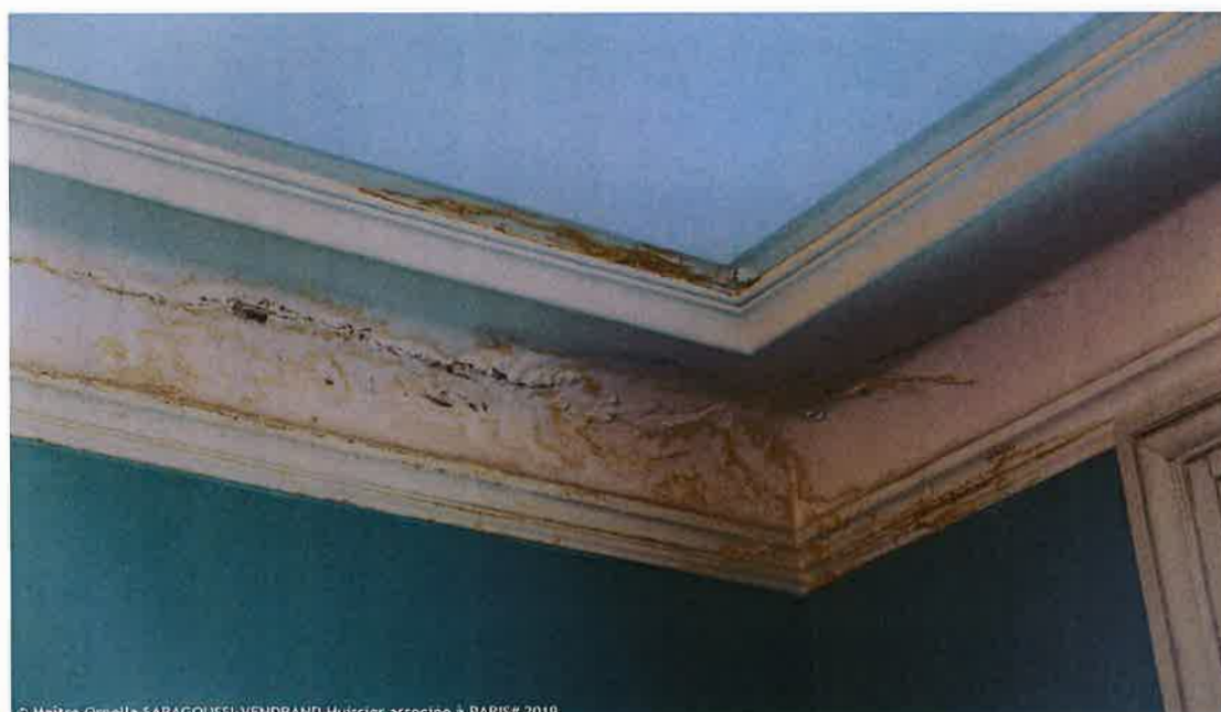
© Maître Ornella SARAGOUSSI-VENDRAND Huissier associée à PARIS# 2019