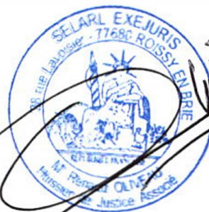
Me Renaud OLIVEAU