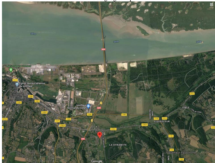
Extrait google map