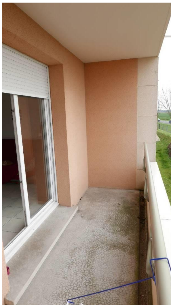
Balcon du séjour

Compte banque CDC : FR27 4003 1000 0100 0012 0530 K96 BIC CDCGFRPP