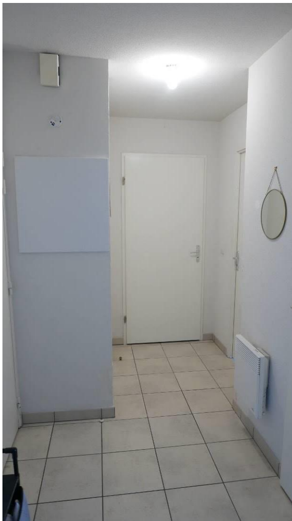
Couloir de distribution