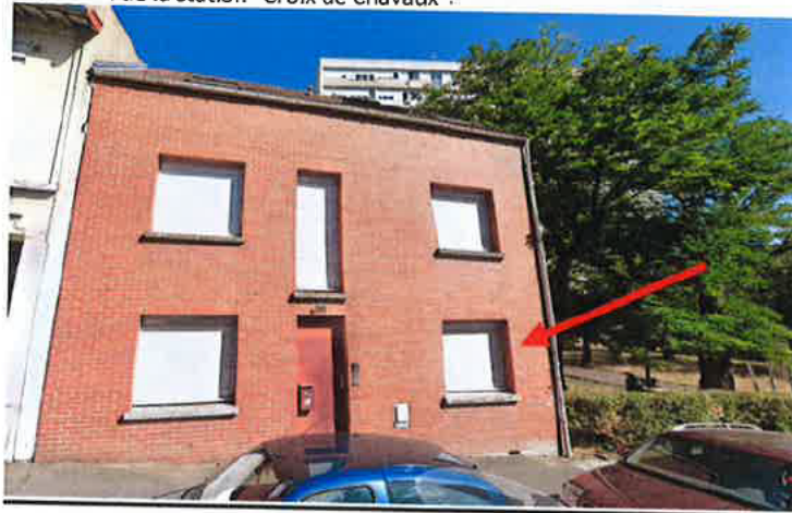
Malgré mes nombreux appels, personne n'ouvre. La voisine m'indique que les lieux sont vides d'occupants.