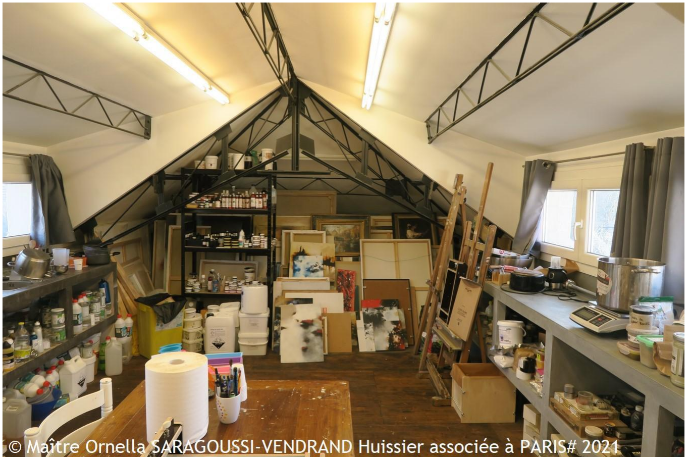
© Maître Ornella SARAGOUSSI-VENDRAND Huissier associée à PARIS# 2021