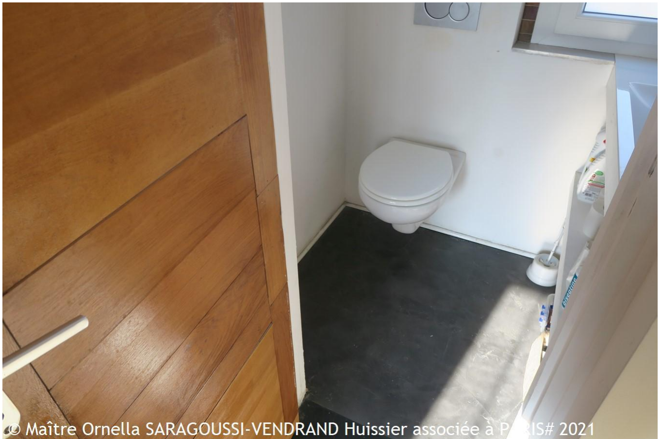
© Maître Ornella SARAGOUSSI-VENDRAND Huissier associée à PARIS# 2021