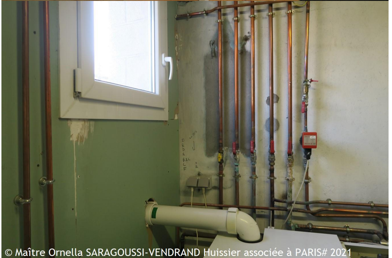
© Maître Ornella SARAGOUSSI-VENDRAND Huissier associée à PARIS# 2021

Ornella SARAGOUSSI-VENDRAND Huissier de Justice 8 rue de Ventadour 75001 PARIS