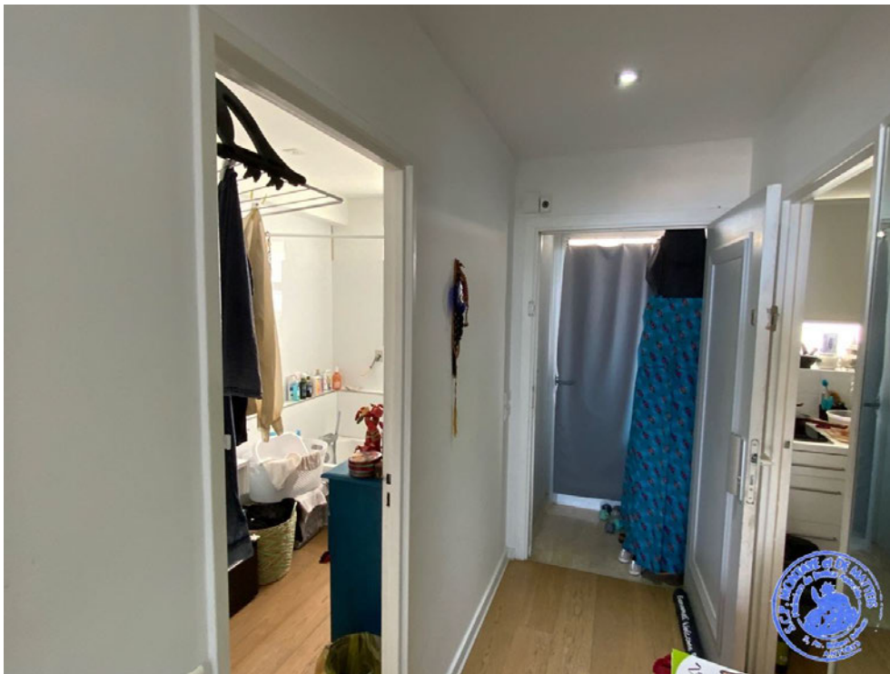
10. Hall d'entrée