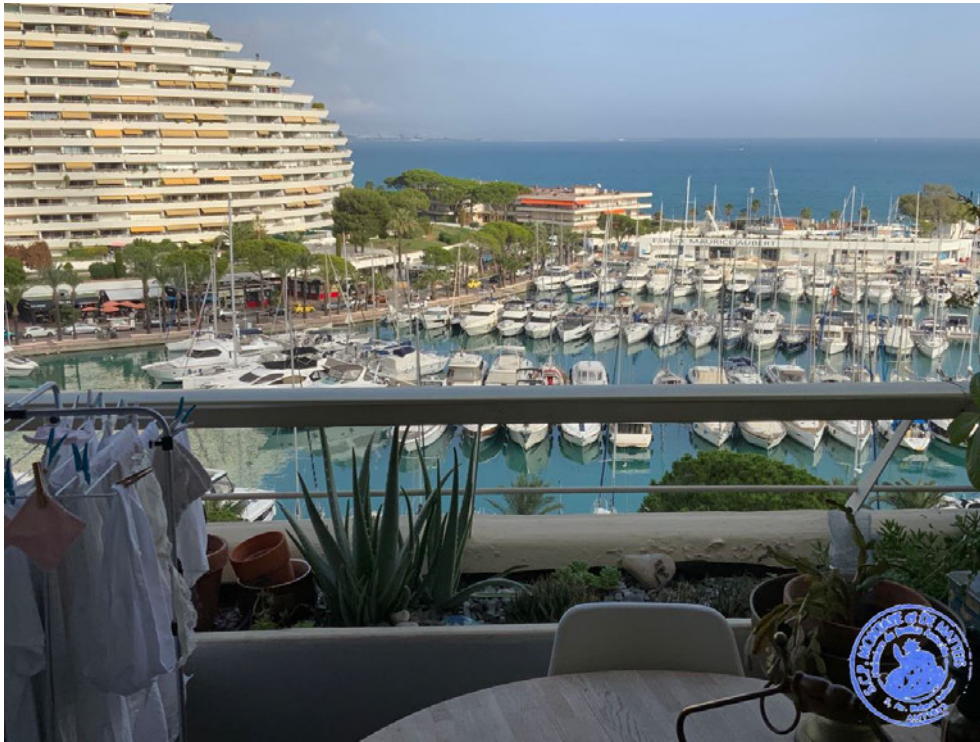
3. Vue depuis le balcon