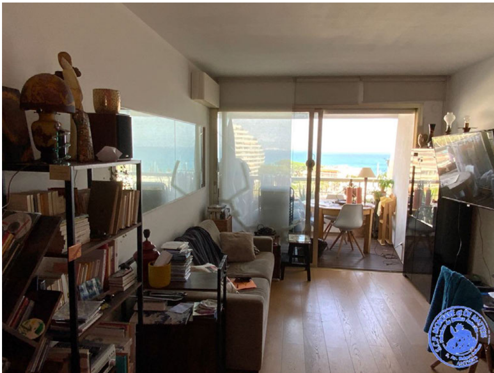
6. Pièce principale