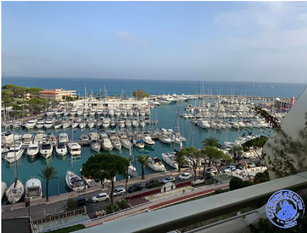
1. Vue depuis le balcon