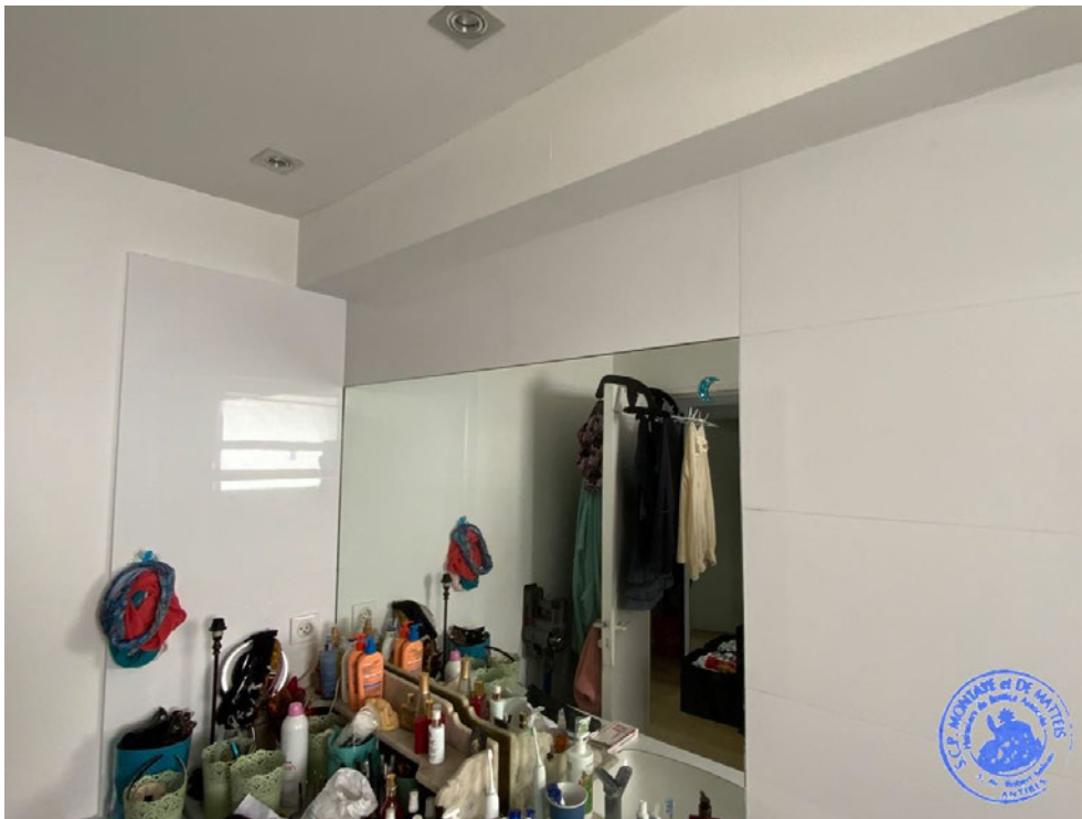
8. Salle de bain