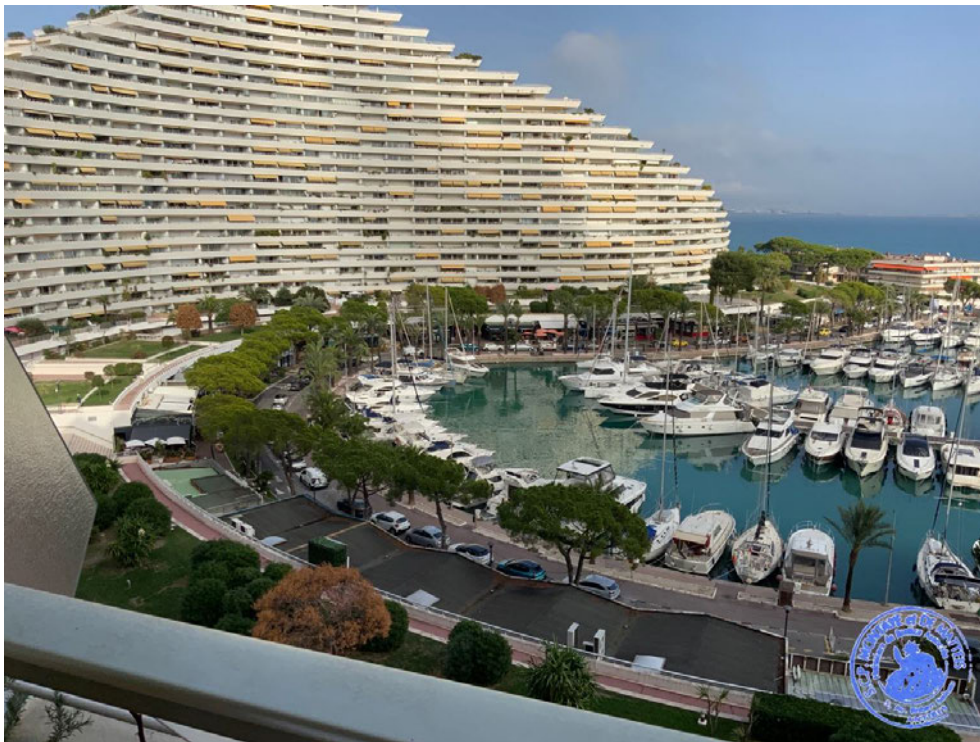
2. Vue depuis le balcon