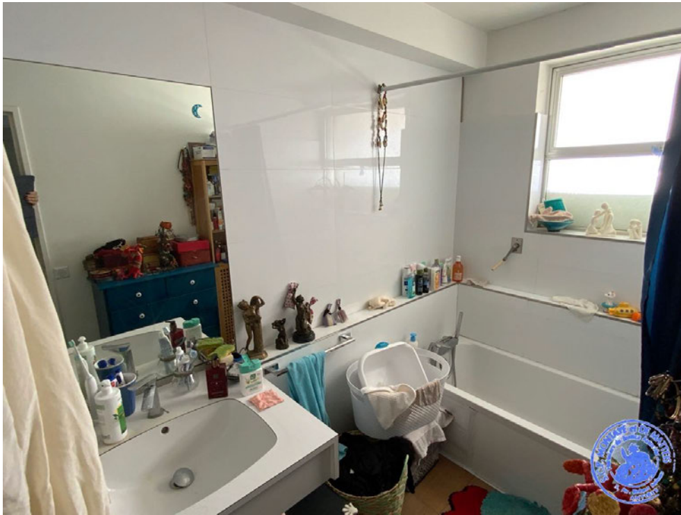
7. Salle de bain