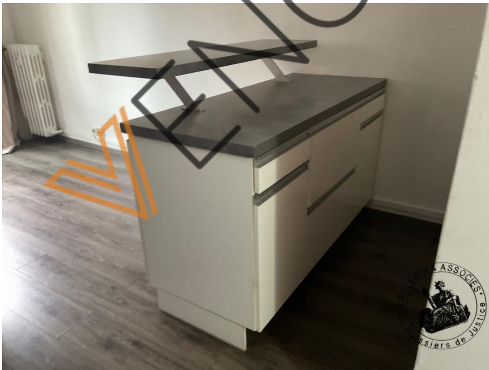
Photographie n°3. (24/02/2023)