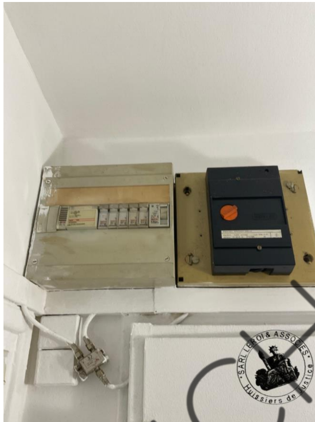
Photographie n°2. (24/02/2023)