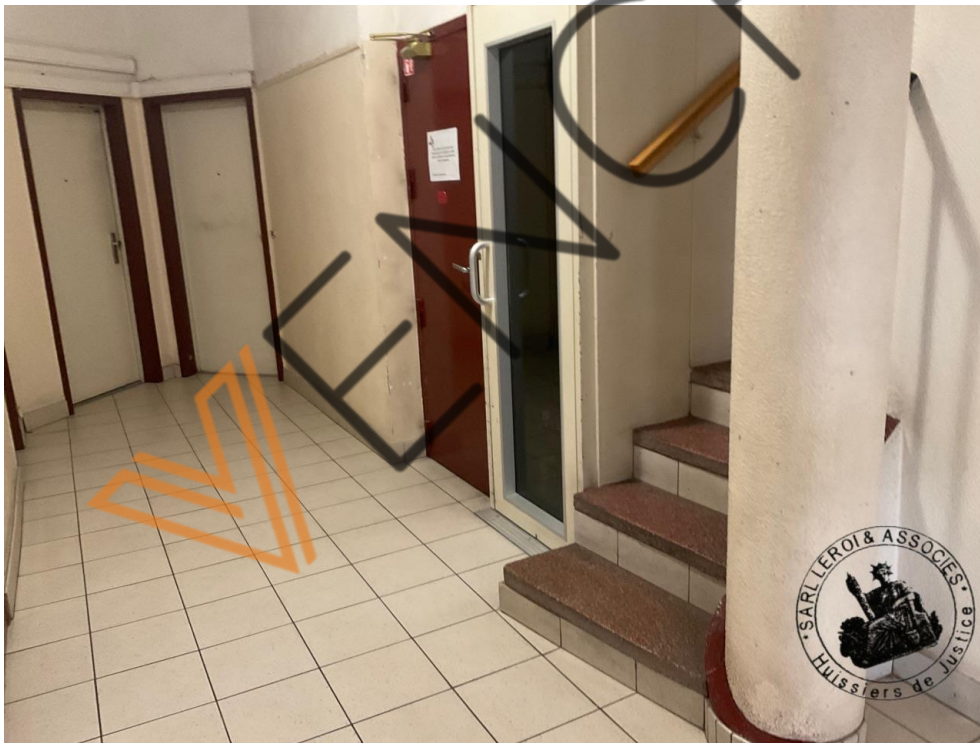
Photographie n°4. (24/02/2023)