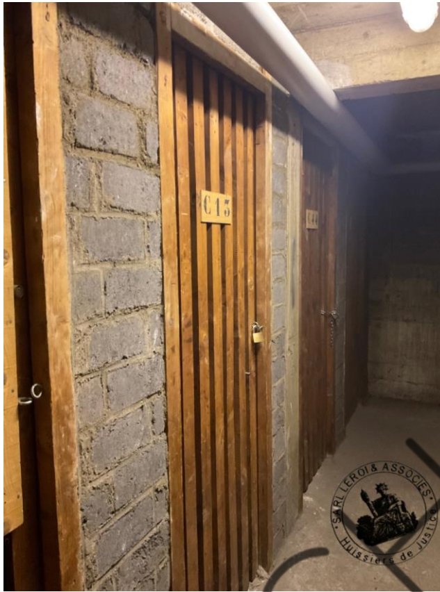
Photographie n°2. (24/02/2023)

De tout ce que dessus, j'ai dressé le présent procès-verbal de constat sur 19 pages pour servir et valoir ce que de droit.