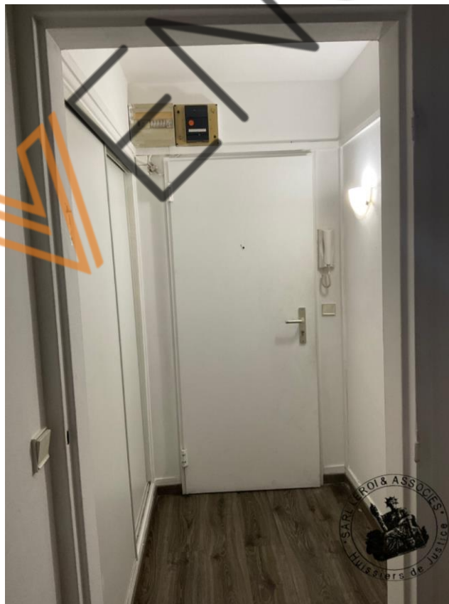
Photographie n°1. (24/02/2023)