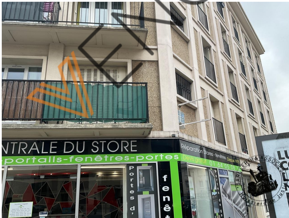
Photographie n°2. (24/02/2023)