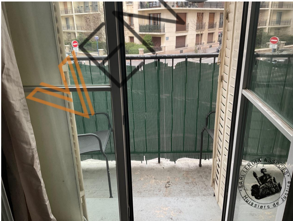
Photographie n°7. (24/02/2023)