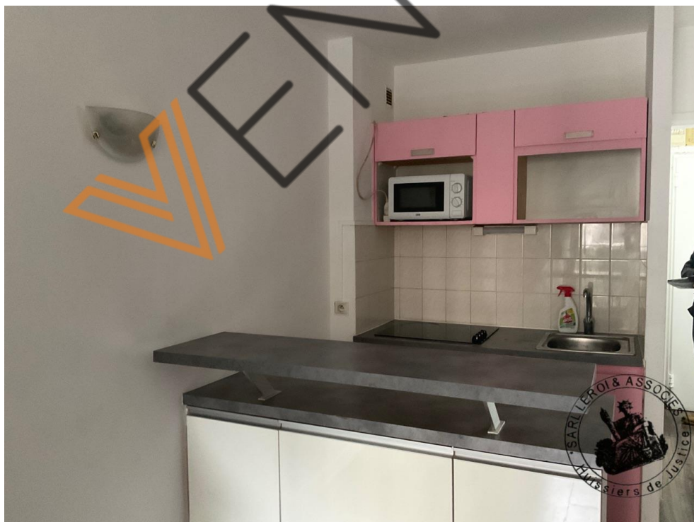
Photographie n°1. (24/02/2023)

Dans l'espace cuisine, il y a un lave-vaisselle.