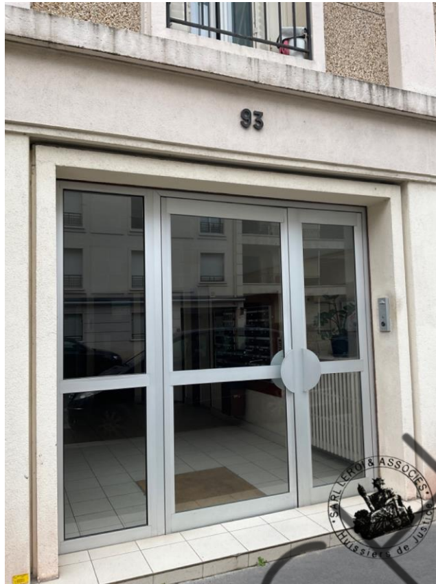
Photographie n°1. (24/02/2023)