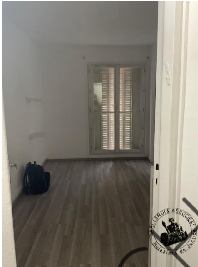
Photographie n°1. (24/02/2023)