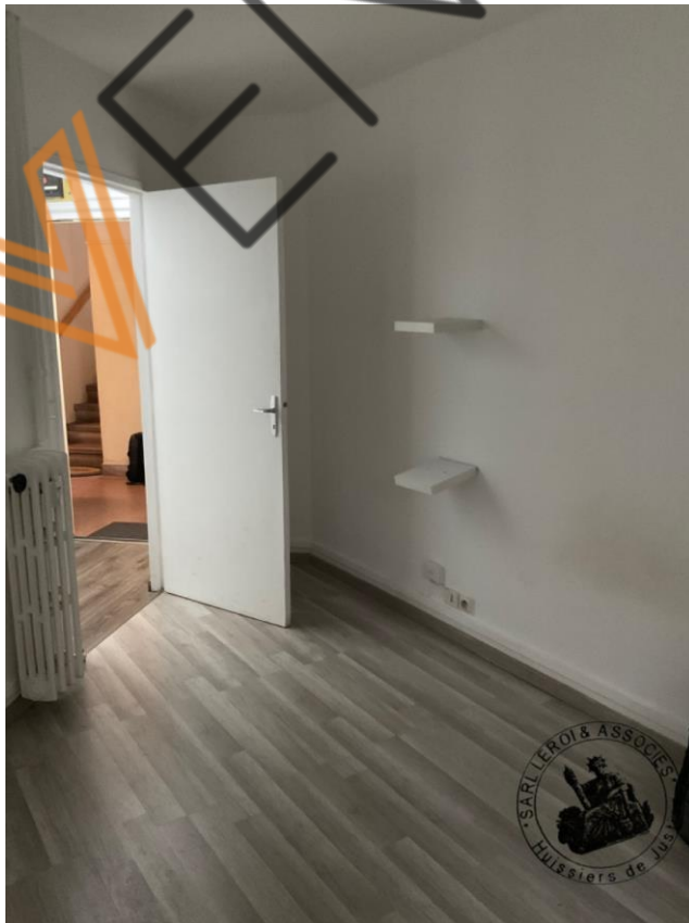
Photographie n°2. (24/02/2023)