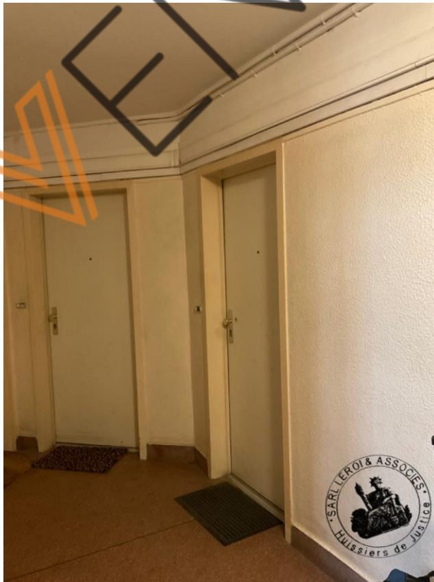
Photographie n°6. (24/02/2023)