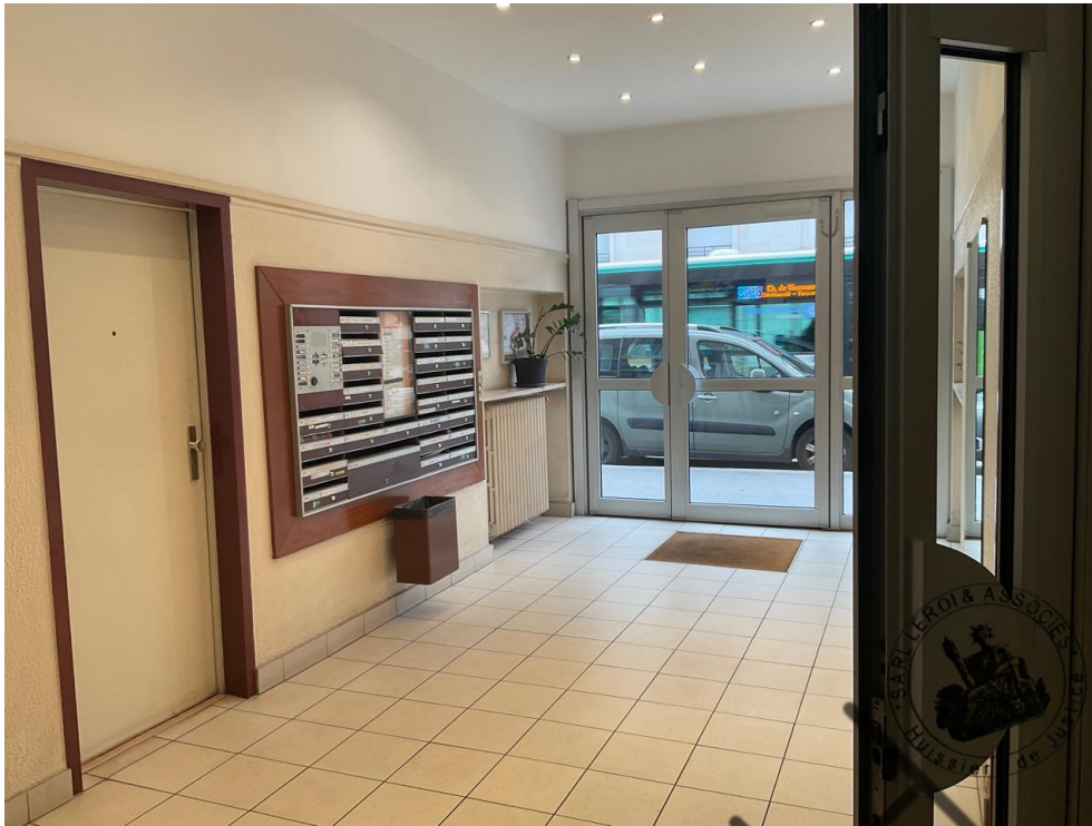
Photographie n°3. (24/02/2023)