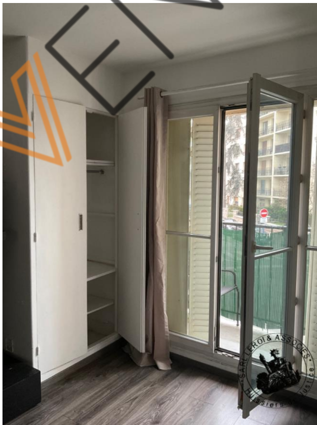
Photographie n°5. (24/02/2023)