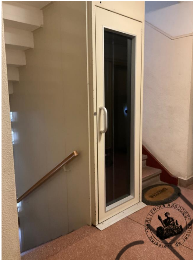
Photographie n°5. (24/02/2023)