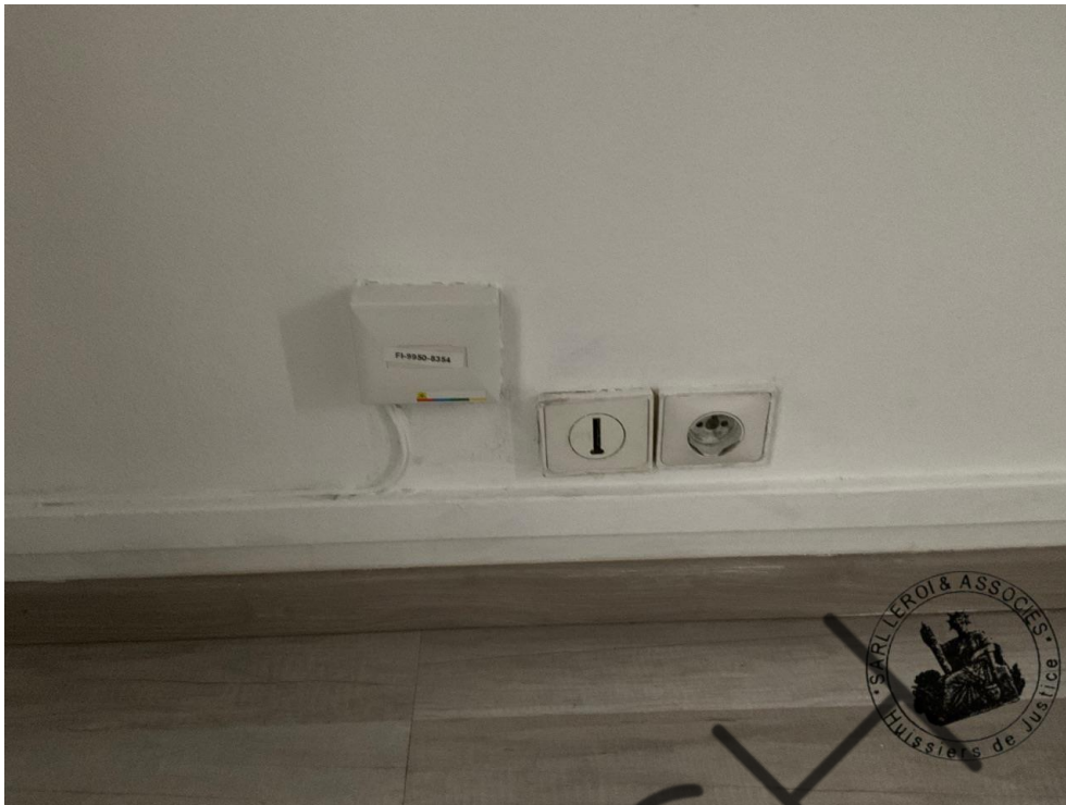
Photographie n°3. (24/02/2023)