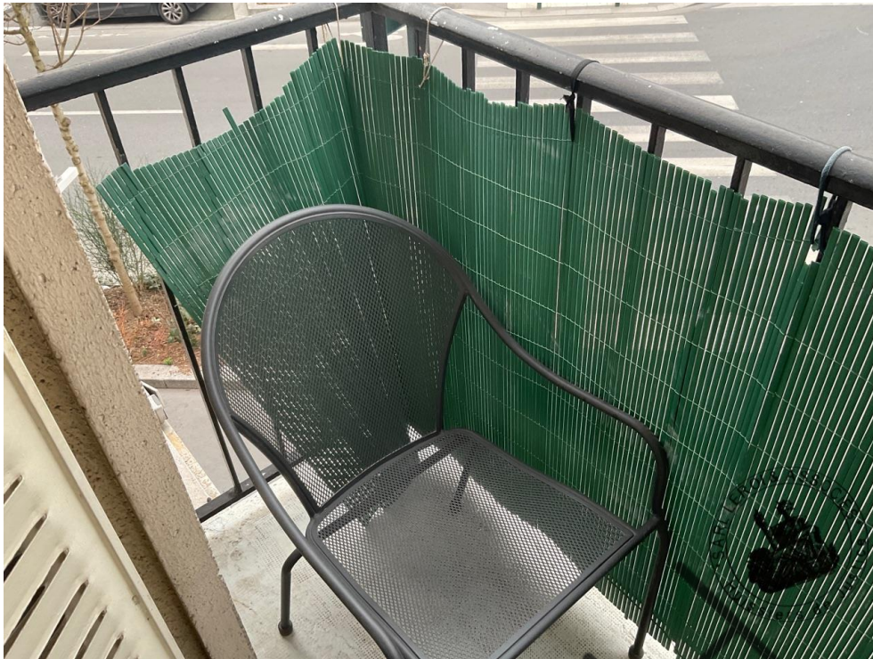
Photographie n°8. (24/02/2023)