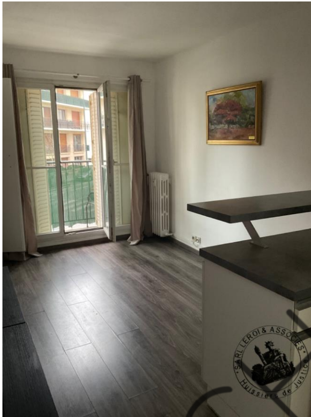
Photographie n°4. (24/02/2023)