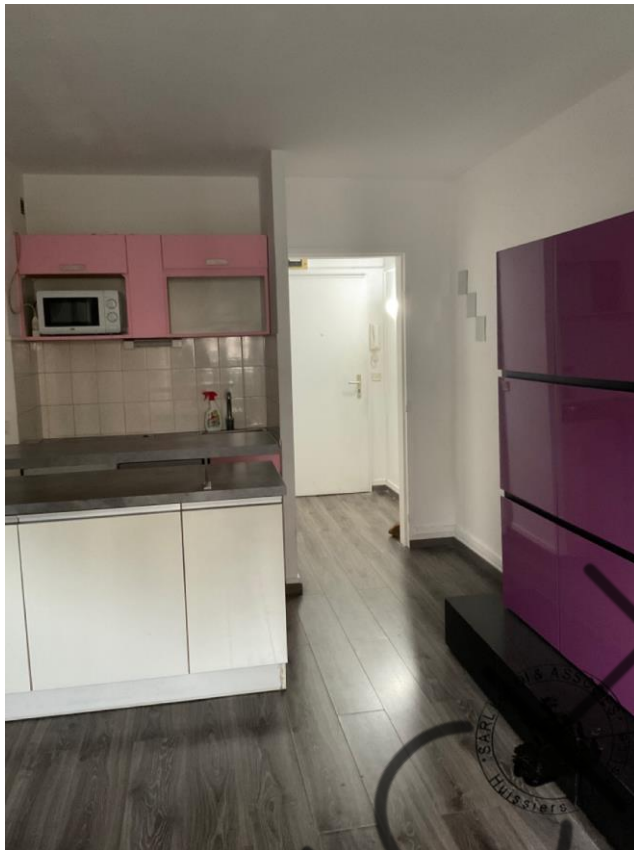
Photographie n°6. (24/02/2023)