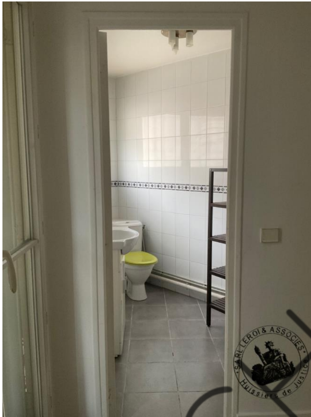
Photographie n°1. (24/02/2023)