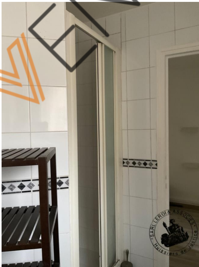
Photographie n°2. (24/02/2023)