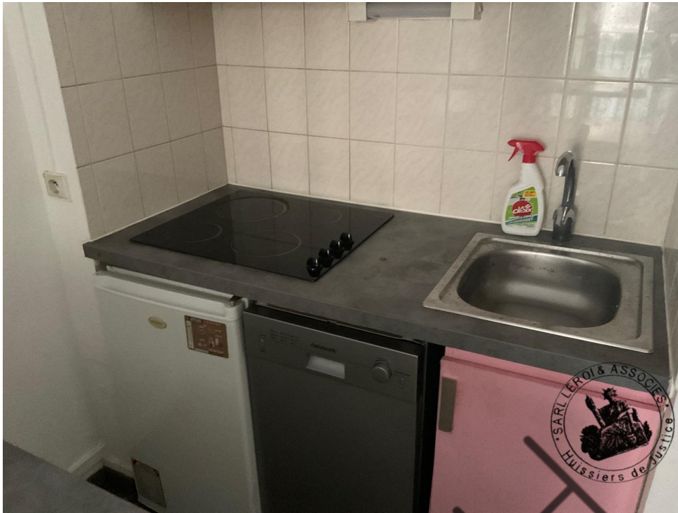
Photographie n°2. (24/02/2023)