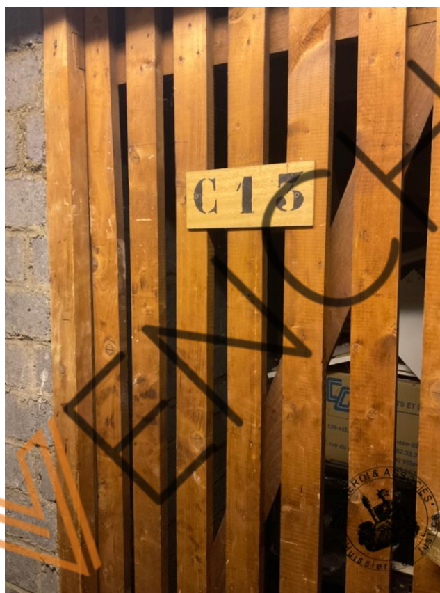
Photographie n°1. (24/02/2023)