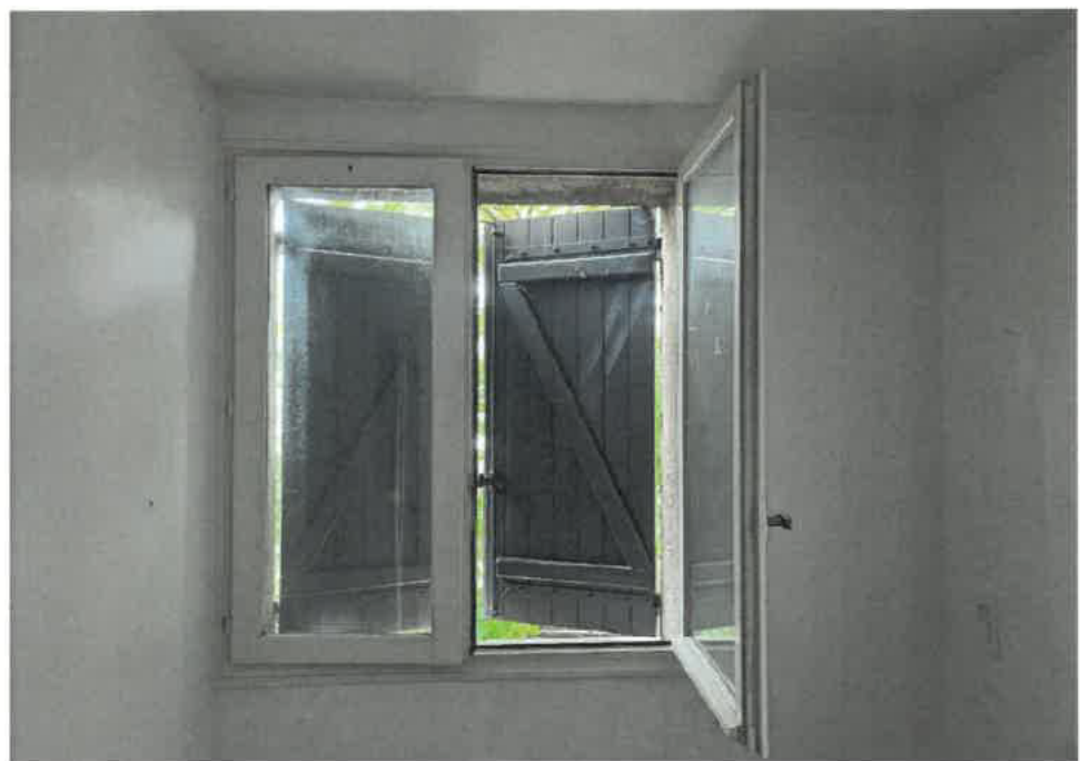
CHAMBRE FACE A LA MONTEE D'ESCALIER