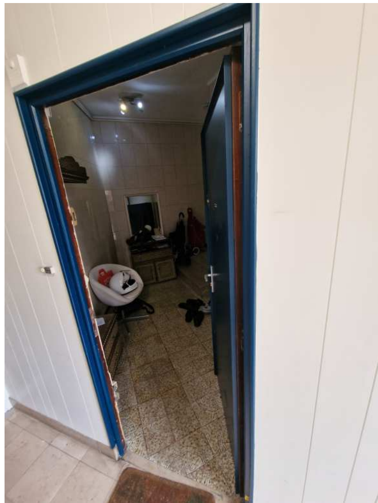
HUISSIERS PARIS-EST NOGENT Photographie n°10