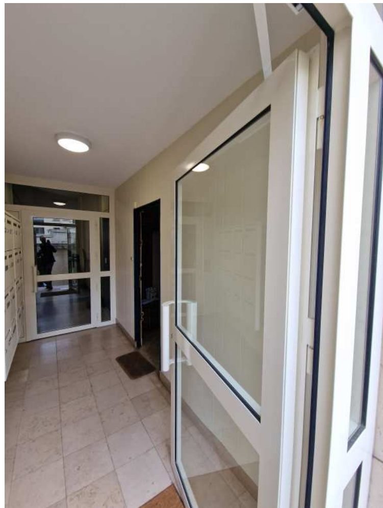
HUISSIERS PARIS-EST NOGENT Photographie n°6