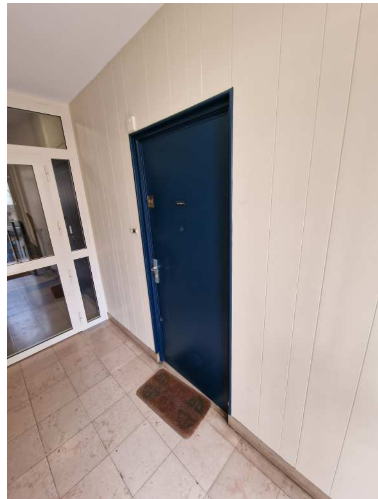
HUISSIERS PARIS-EST NOGENT Photographie n°9