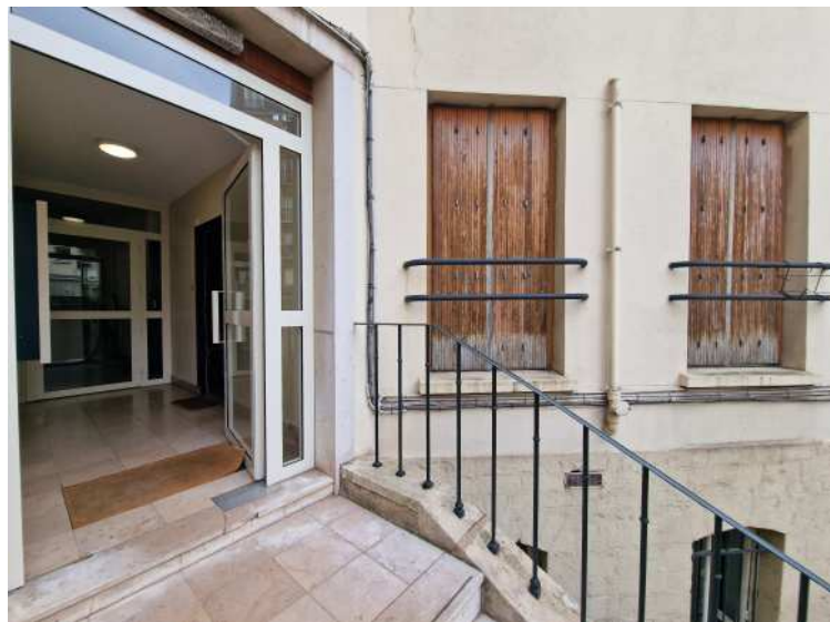
HUISSIERS PARIS-EST NOGENT Photographie n°2