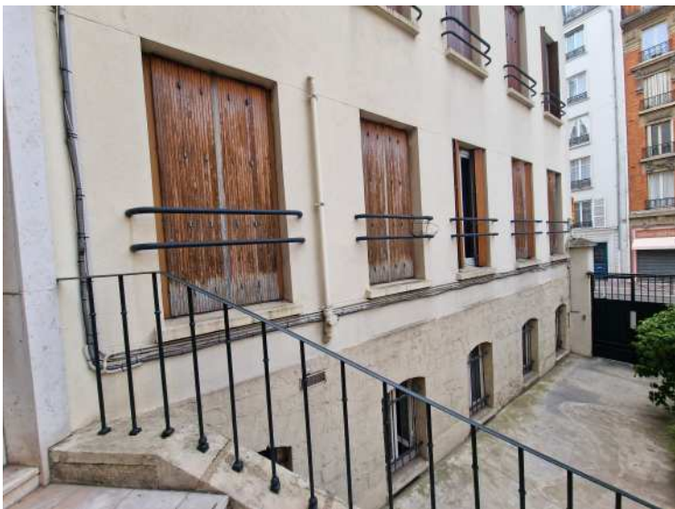
HUISSIERS PARIS-EST NOGENT Photographie n°3