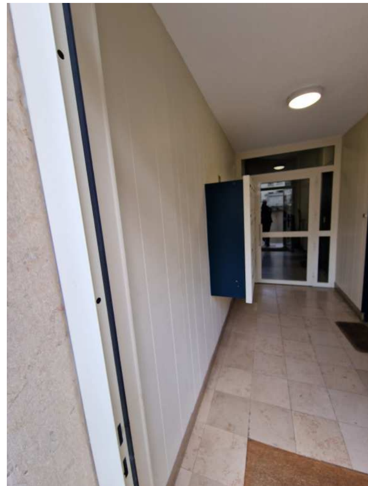
HUISSIERS PARIS-EST NOGENT Photographie n°5