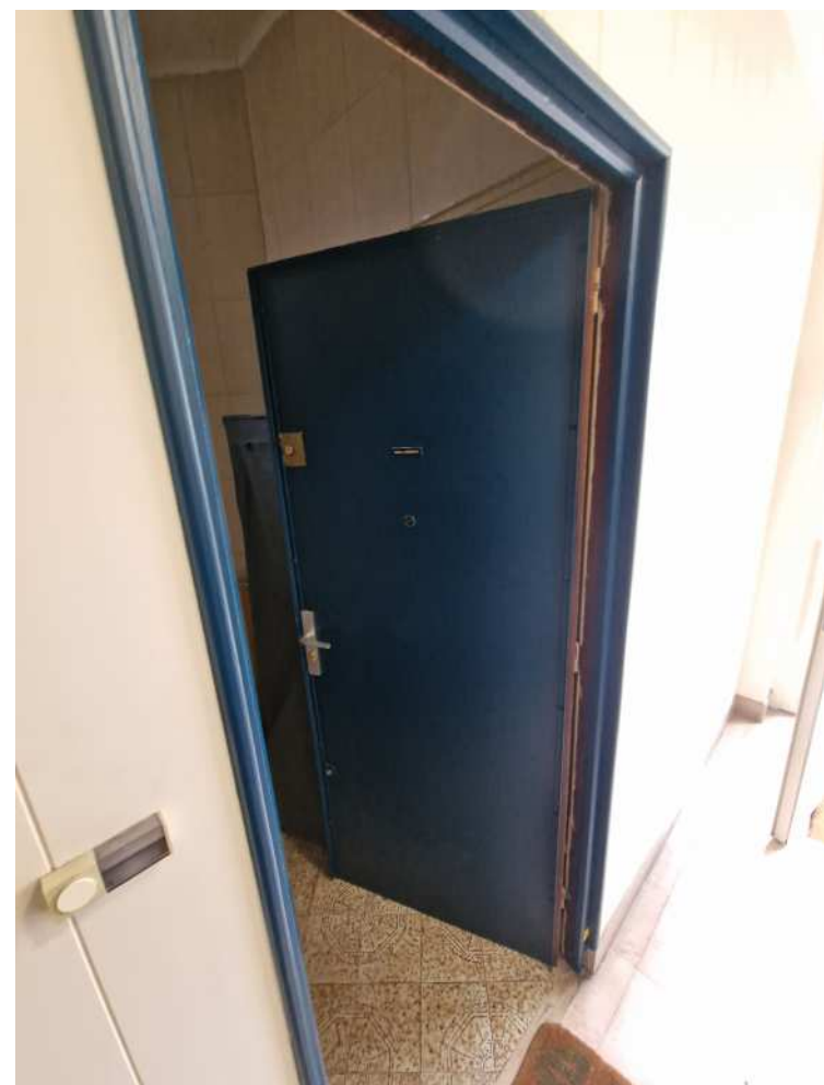
HUISSIERS PARIS-EST NOGENT Photographie n°11