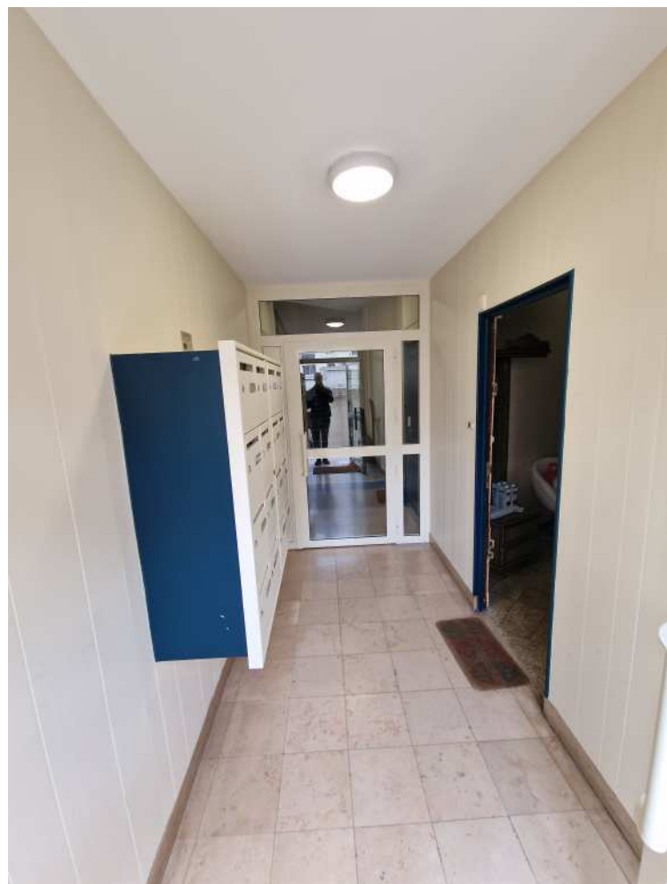
HUISSIERS PARIS-EST NOGENT Photographie n°8