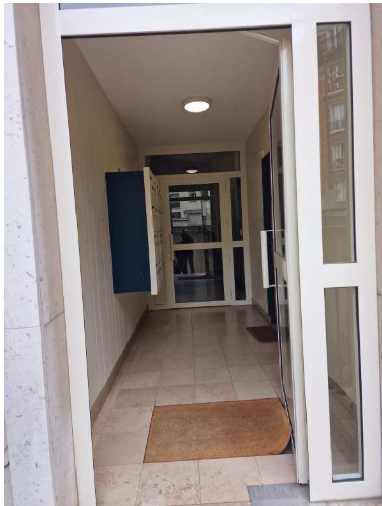
HUISSIERS PARIS-EST NOGENT Photographie n°4