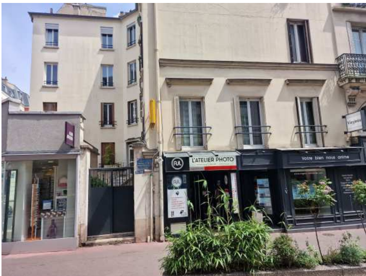
HUISSIERS PARIS-EST NOGENT Photographie n°1