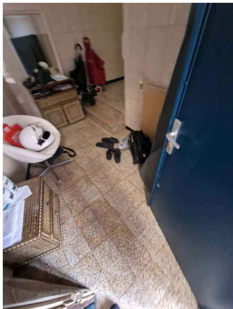
HUISSIERS PARIS-EST NOGENT Photographie n°12