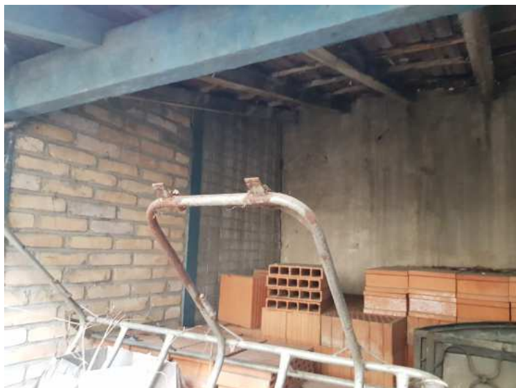
HUISSIERS PARIS EST NOGENT- photographies n°22