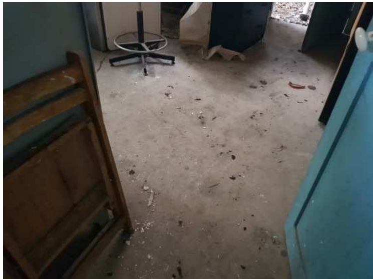
HUISSIERS PARIS EST NOGENT- photographies n°10