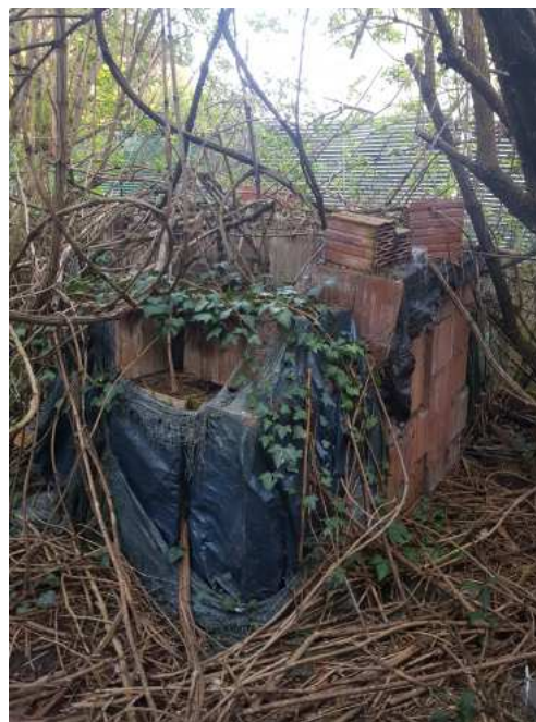
HUISSIERS PARIS EST NOGENT- photographies n°48