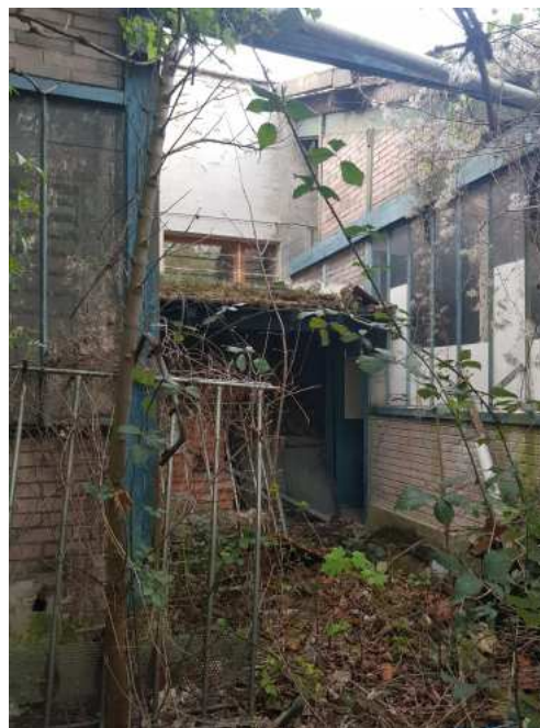
HUISSIERS PARIS EST NOGENT- photographies n°52