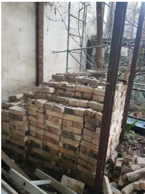
HUISSIERS PARIS EST NOGENT- photographies n°43