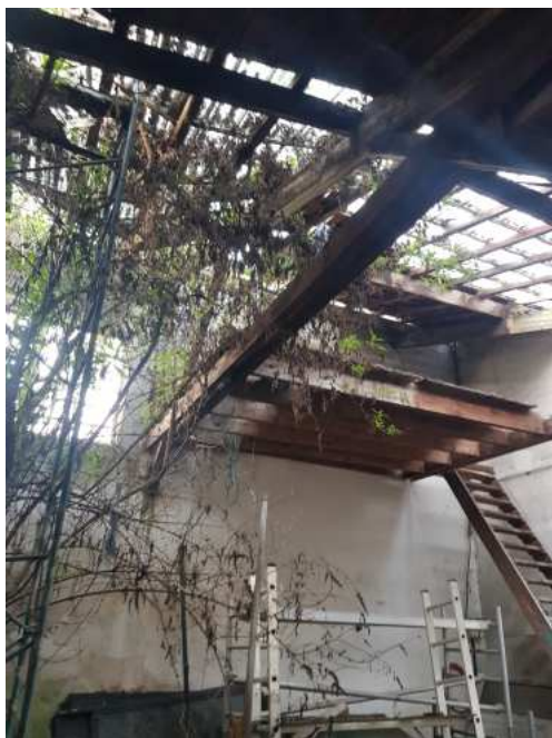
HUISSIERS PARIS EST NOGENT- photographies n°41