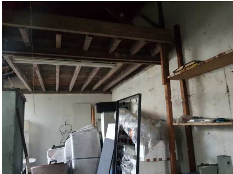
HUISSIERS PARIS EST NOGENT- photographies n°34