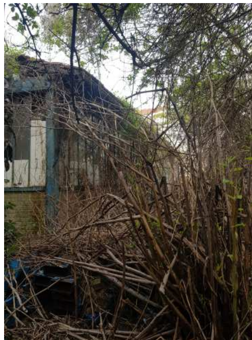
HUISSIERS PARIS EST NOGENT- photographies n°50