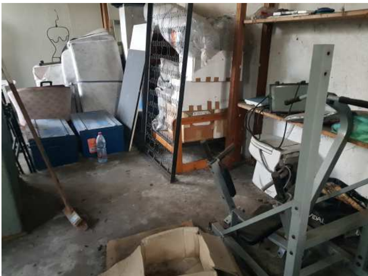
HUISSIERS PARIS EST NOGENT- photographies n°35