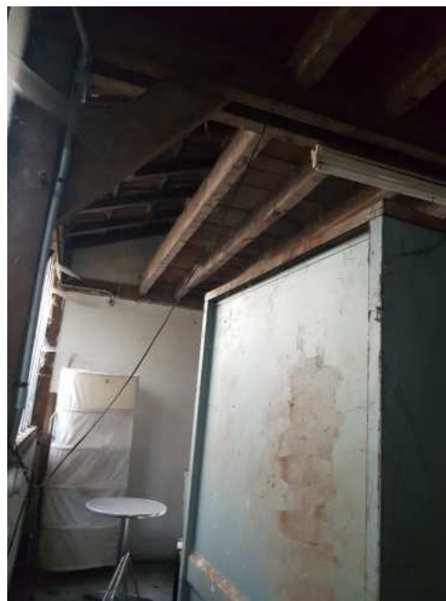
HUISSIERS PARIS EST NOGENT- photographies n°46