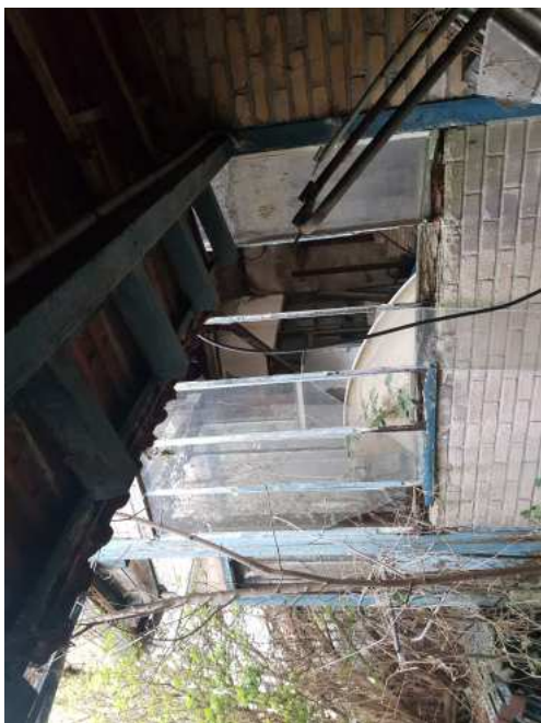
HUISSIERS PARIS EST NOGENT- photographies n°17