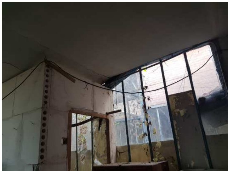
HUISSIERS PARIS EST NOGENT- photographies n°12