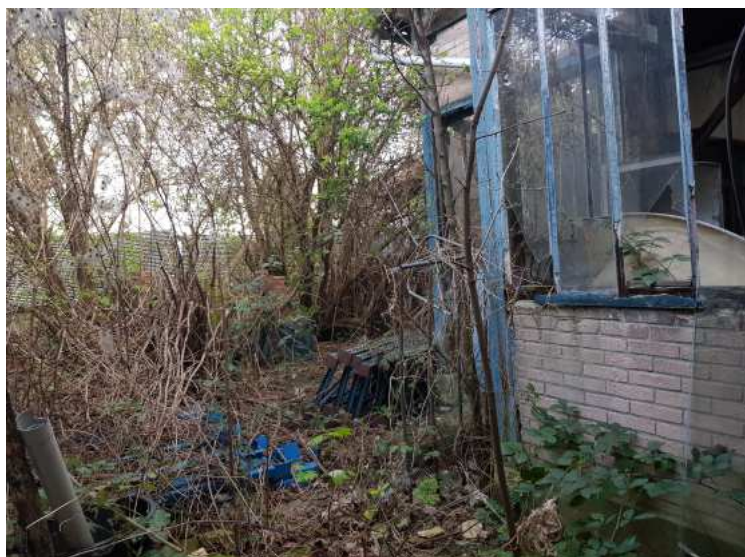
HUISSIERS PARIS EST NOGENT- photographies n°18