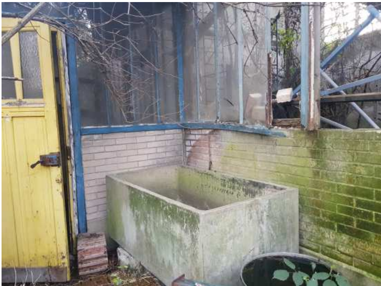
HUISSIERS PARIS EST NOGENT- photographies n°27