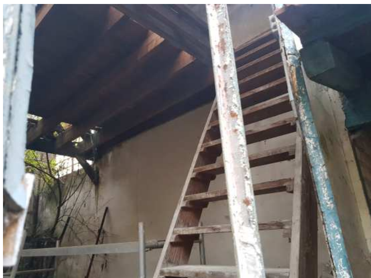
HUISSIERS PARIS EST NOGENT- photographies n°24