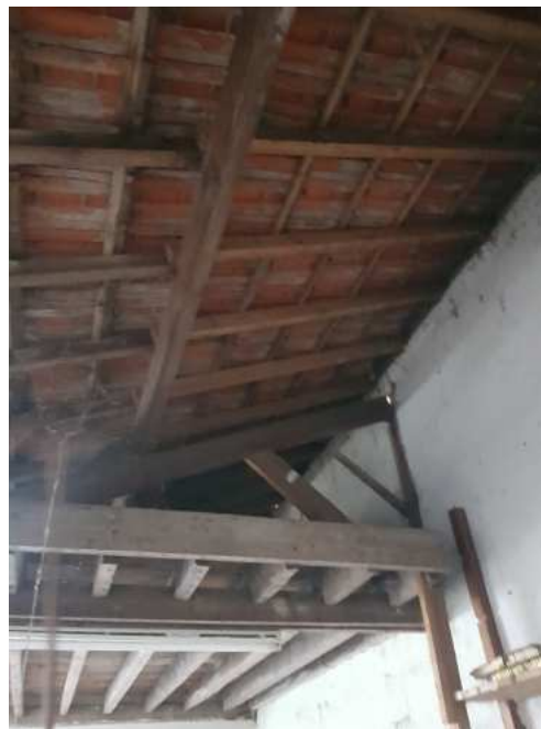
HUISSIERS PARIS EST NOGENT- photographies n°44