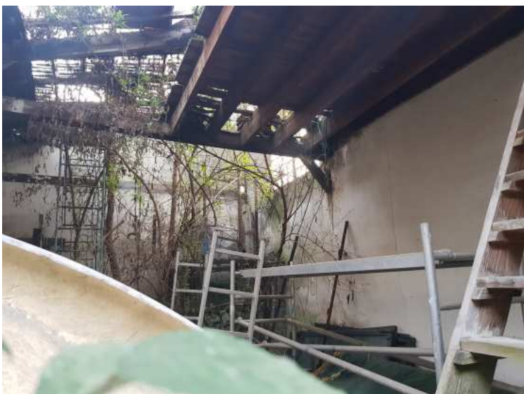
HUISSIERS PARIS EST NOGENT- photographies n°23