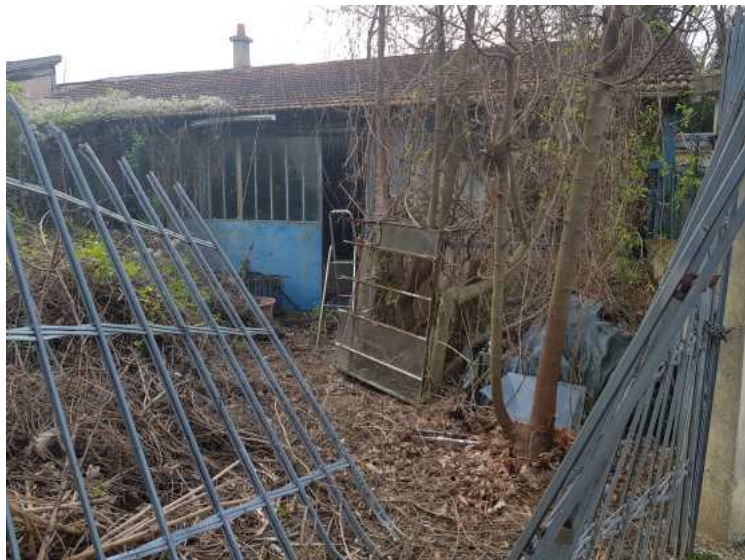
HUISSIERS PARIS EST NOGENT- photographies n°2