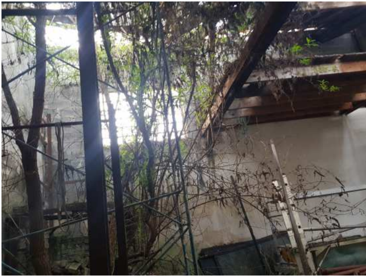
HUISSIERS PARIS EST NOGENT- photographies n°31