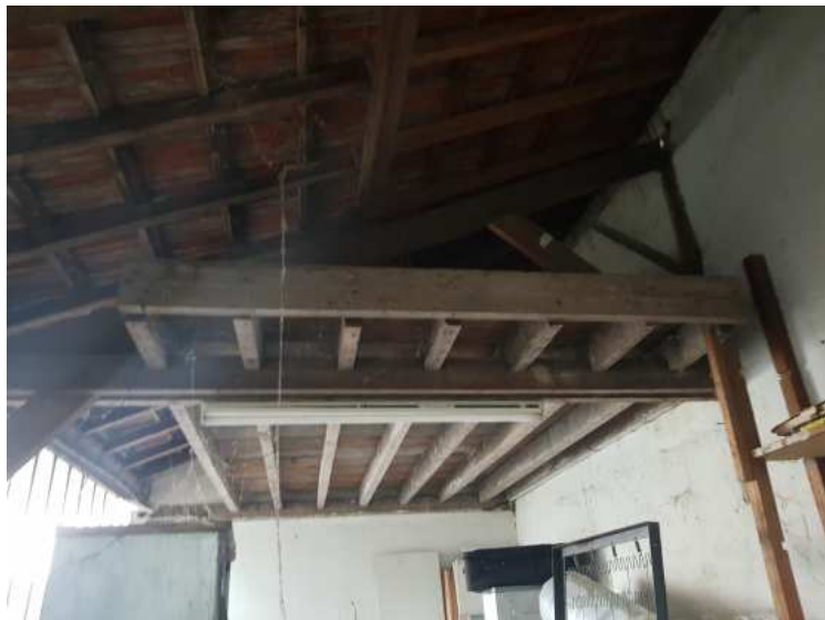
HUISSIERS PARIS EST NOGENT- photographies n°38