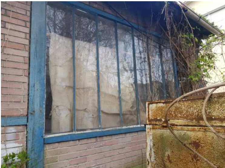
HUISSIERS PARIS EST NOGENT- photographies n°3