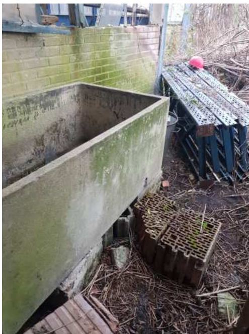
HUISSIERS PARIS EST NOGENT- photographies n°47