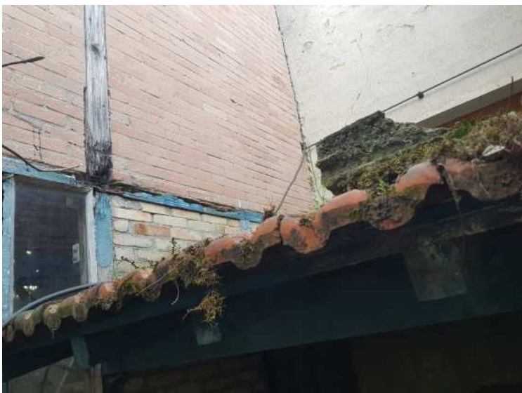
HUISSIERS PARIS EST NOGENT- photographies n°21