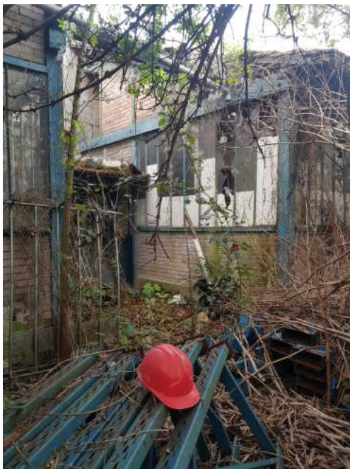
HUISSIERS PARIS EST NOGENT- photographies n°49