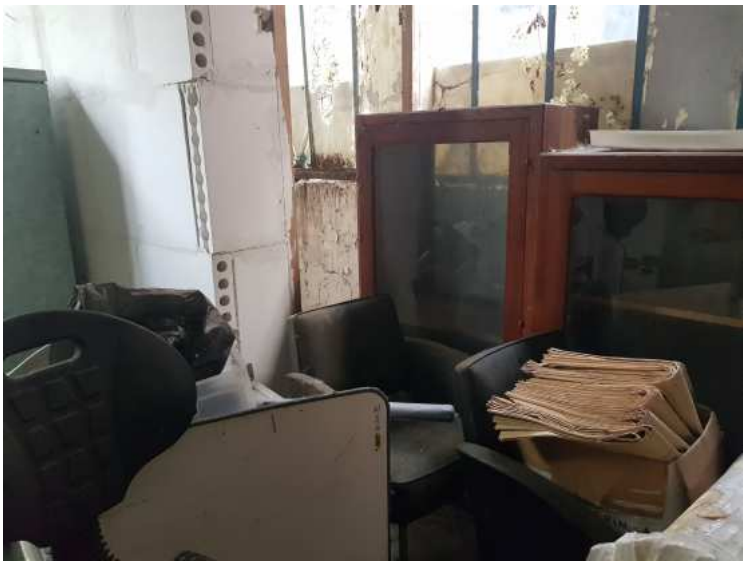
HUISSIERS PARIS EST NOGENT- photographies n°13