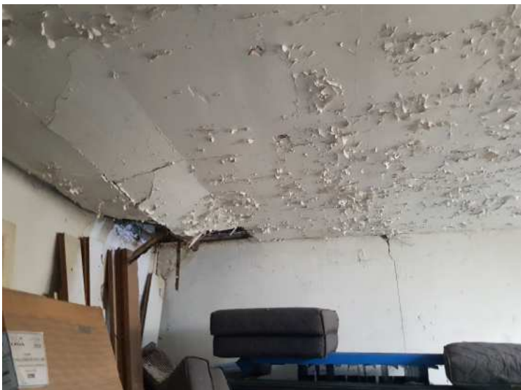
HUISSIERS PARIS EST NOGENT- photographies n°5