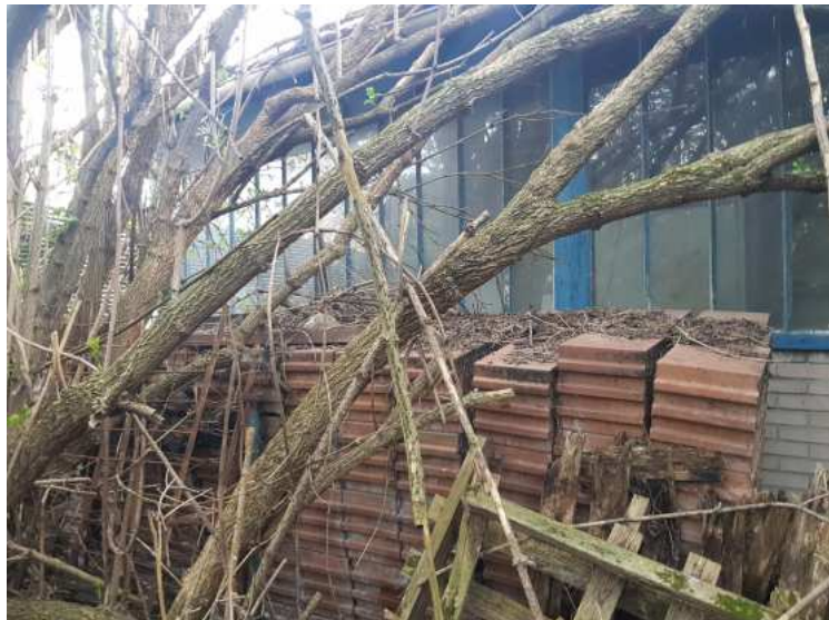
HUISSIERS PARIS EST NOGENT- photographies n°28