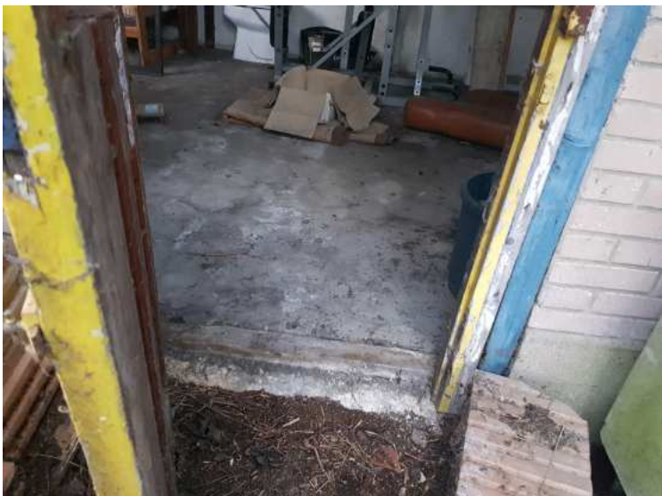
HUISSIERS PARIS EST NOGENT- photographies n°29