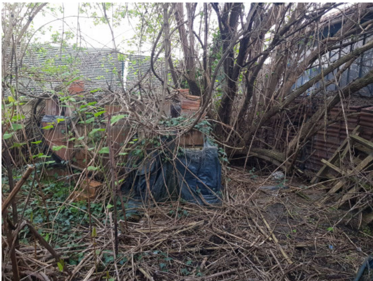
HUISSIERS PARIS EST NOGENT- photographies n°25