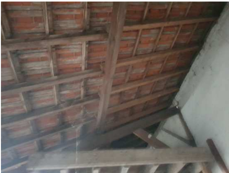
HUISSIERS PARIS EST NOGENT- photographies n°37