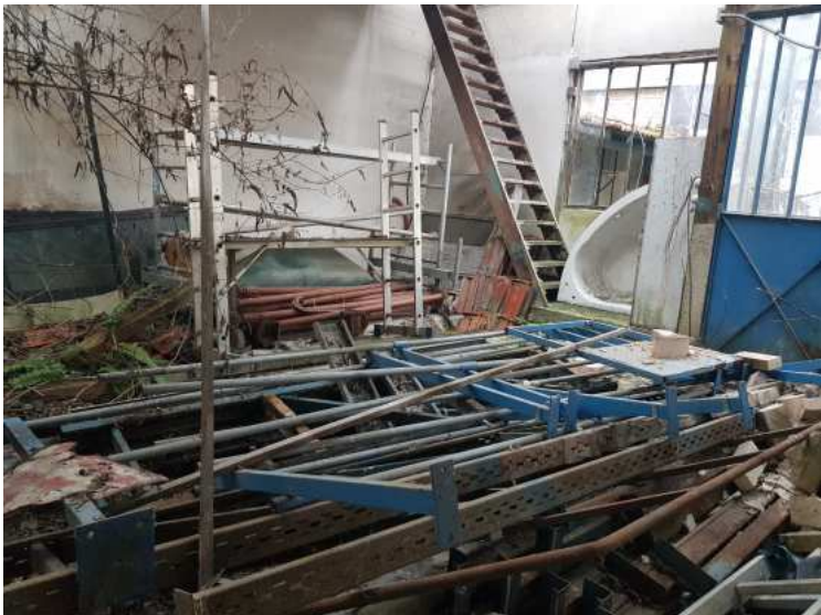
HUISSIERS PARIS EST NOGENT- photographies n°33