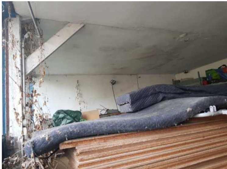
HUISSIERS PARIS EST NOGENT- photographies n°4