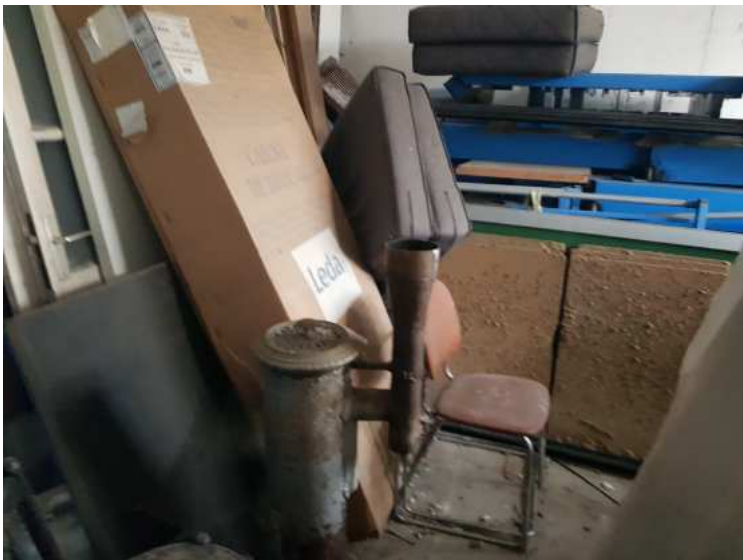
HUISSIERS PARIS EST NOGENT- photographies n°7