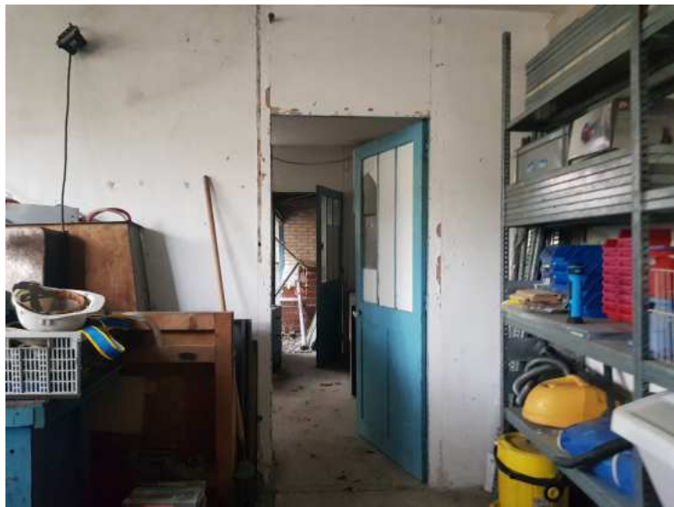
HUISSIERS PARIS EST NOGENT- photographies n°8