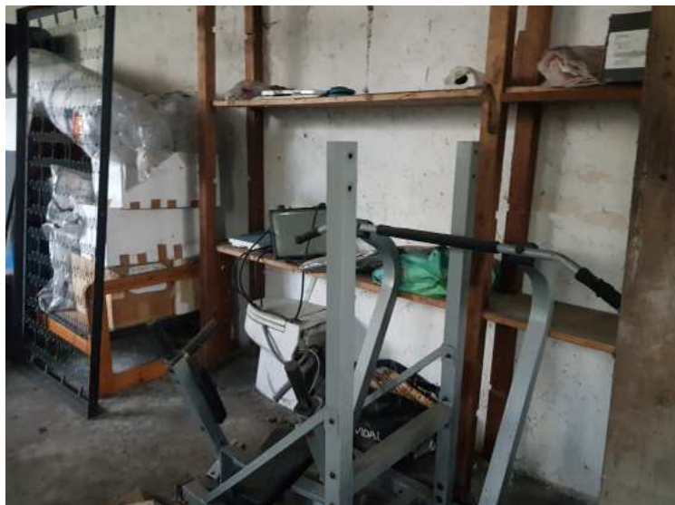
HUISSIERS PARIS EST NOGENT- photographies n°36