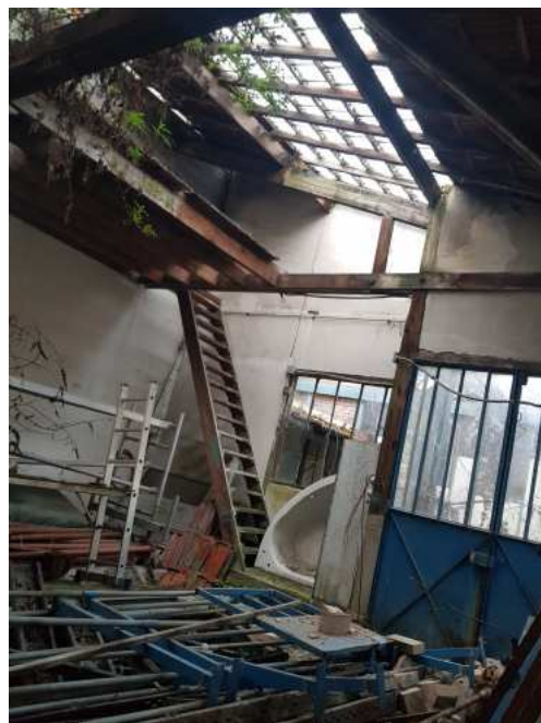
HUISSIERS PARIS EST NOGENT- photographies n°40