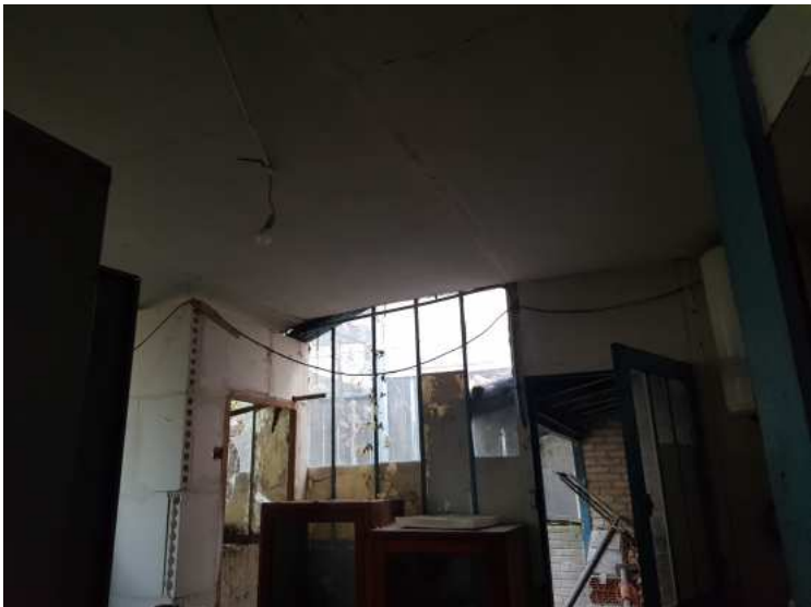
HUISSIERS PARIS EST NOGENT- photographies n°9