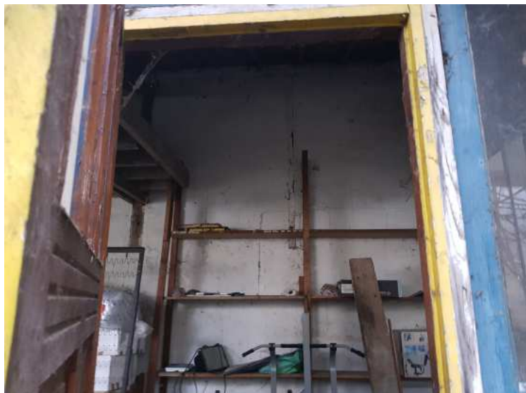
HUISSIERS PARIS EST NOGENT- photographies n°30