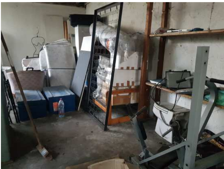
HUISSIERS PARIS EST NOGENT- photographies n°39