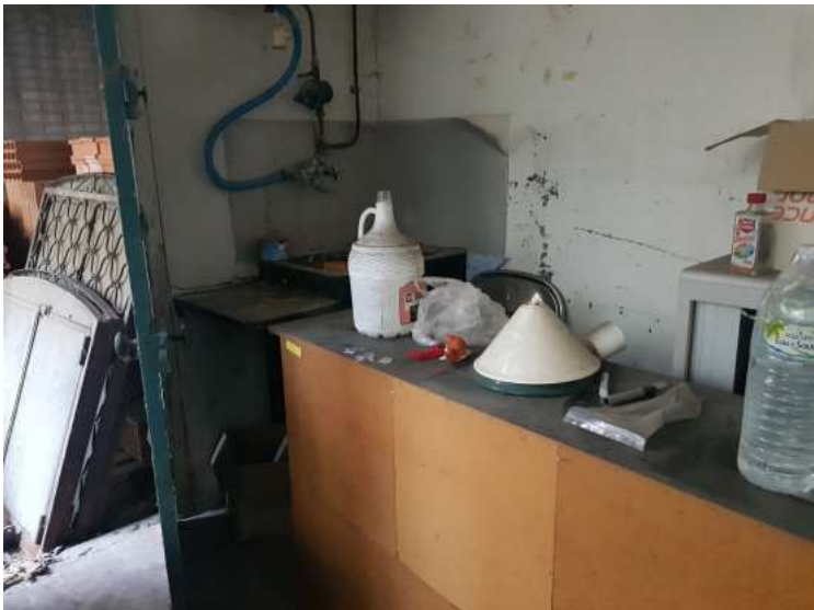
HUISSIERS PARIS EST NOGENT- photographies n°15