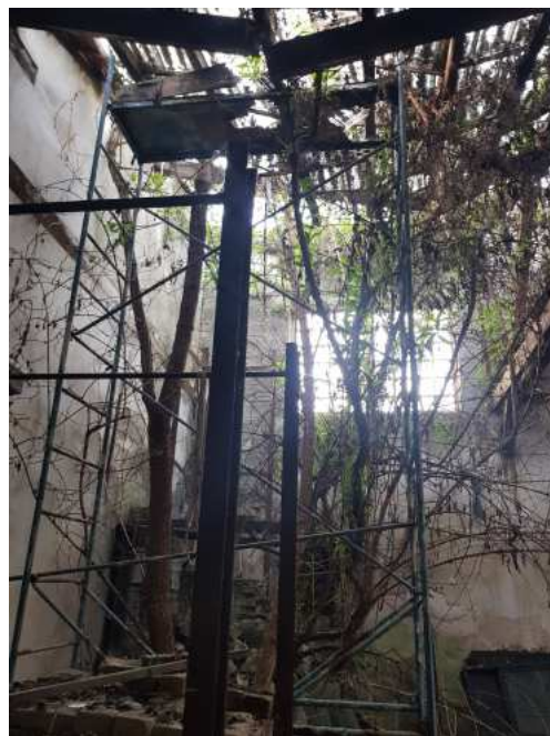
HUISSIERS PARIS EST NOGENT- photographies n°42