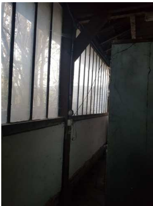
HUISSIERS PARIS EST NOGENT- photographies n°45