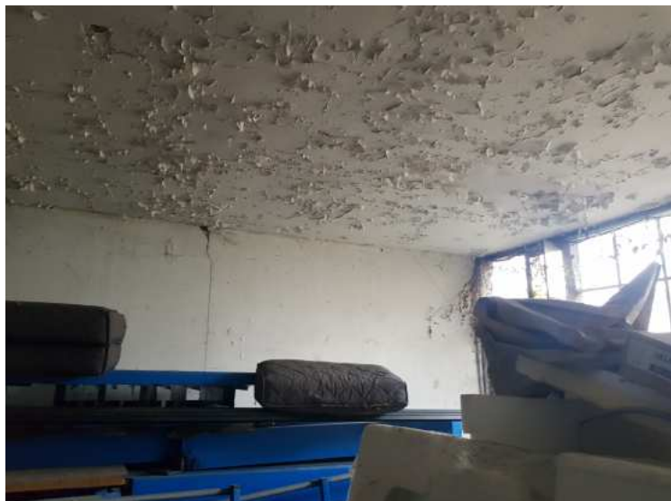
HUISSIERS PARIS EST NOGENT- photographies n°6