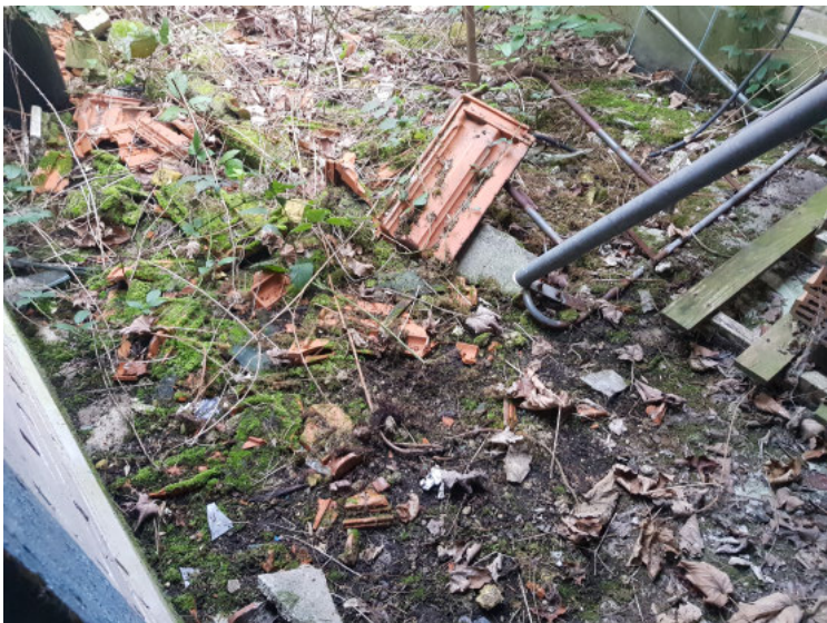
HUISSIERS PARIS EST NOGENT- photographies n°19