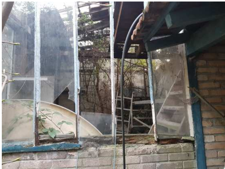
HUISSIERS PARIS EST NOGENT- photographies n°20