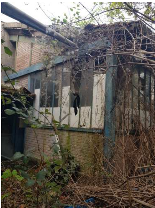
HUISSIERS PARIS EST NOGENT- photographies n°51