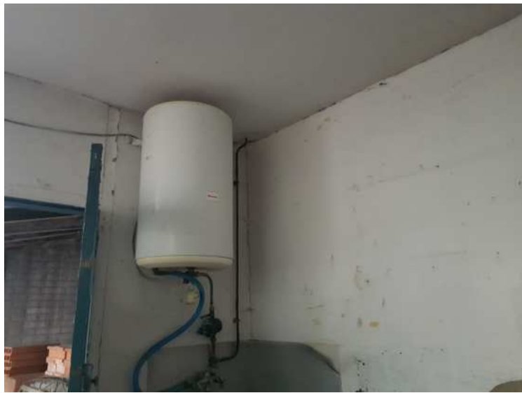
HUISSIERS PARIS EST NOGENT- photographies n°14