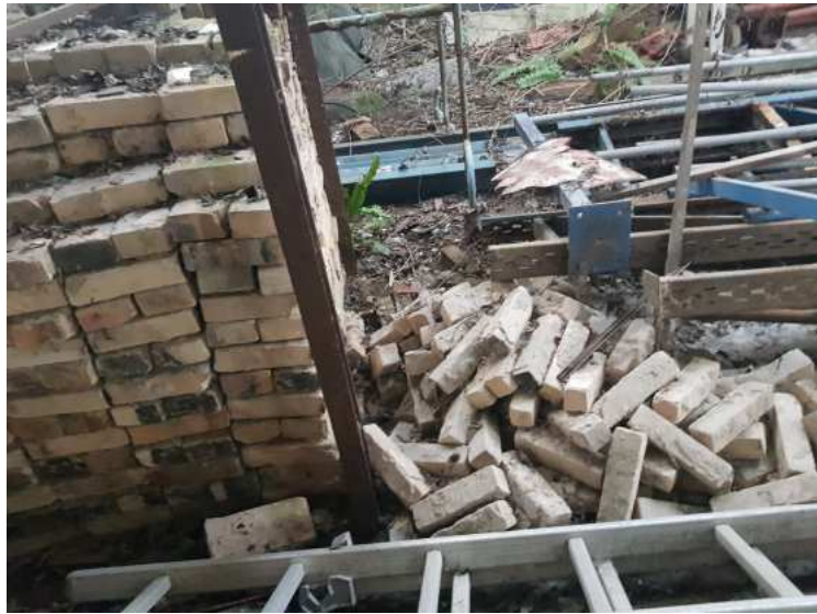
HUISSIERS PARIS EST NOGENT- photographies n°32