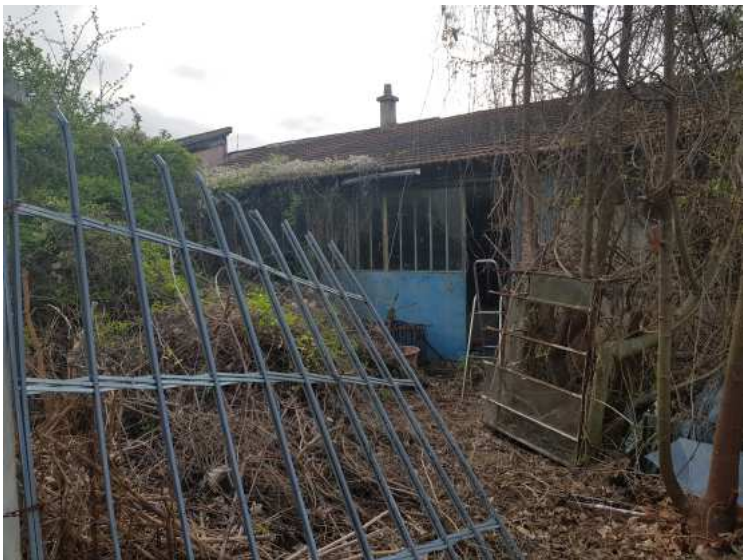
HUISSIERS PARIS EST NOGENT- photographies n°1