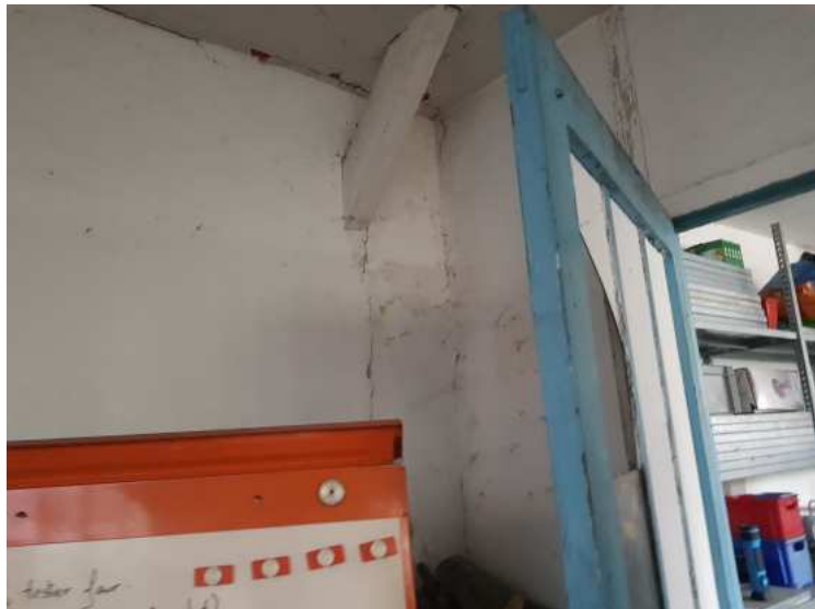
HUISSIERS PARIS EST NOGENT- photographies n°16