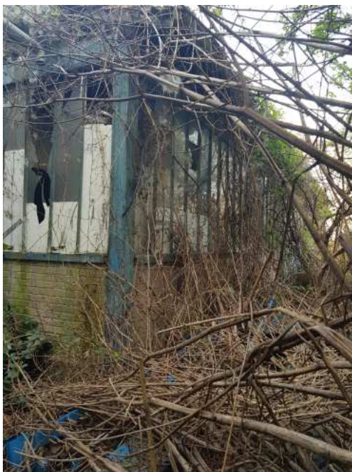
HUISSIERS PARIS EST NOGENT- photographies n°53