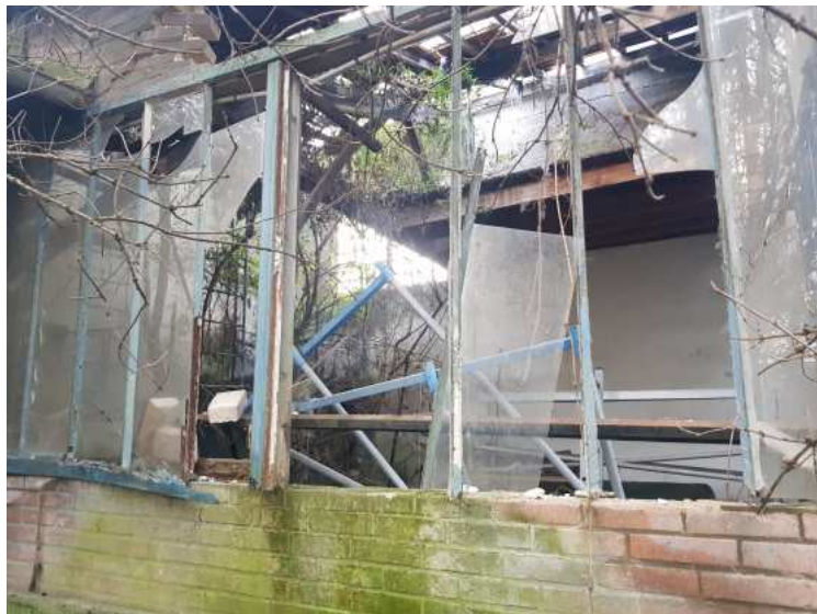
HUISSIERS PARIS EST NOGENT- photographies n°26