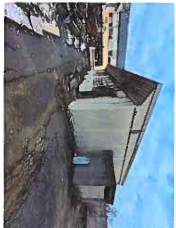
Bâtiment détruit par l'incendie de septembre 2021