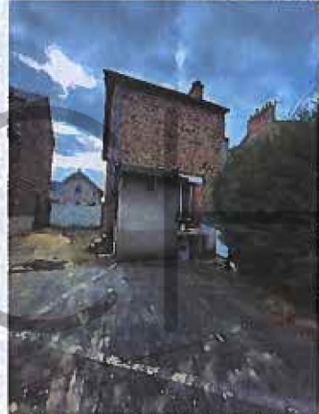
Maison non visitée (pas de clef)