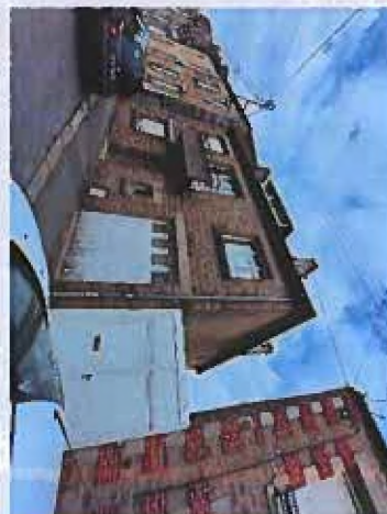
Entrée principale au 47 rue Edmond Roussin : 1