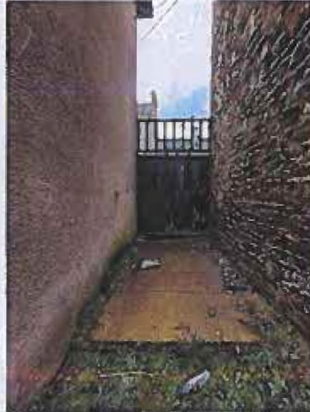
Vanne supposée d'alimentation principale en eau (entre 2 maisons)