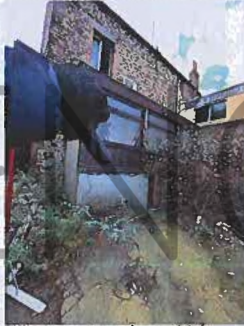
Maison et sous-sol non visités