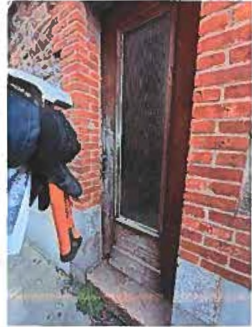
Maison non visitée