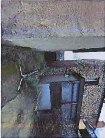
Détecteur de présence

██████████ à Fougères 09/02/2023 • Extérieurs et abords du site