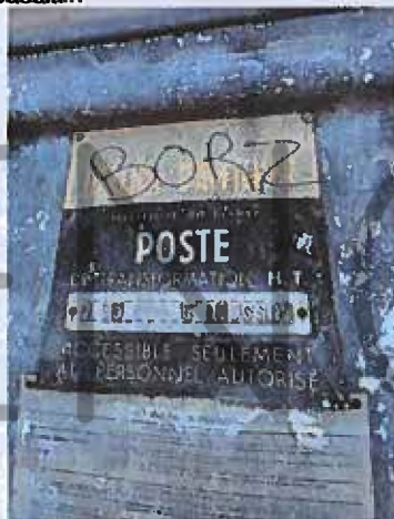
Poste transfo hors périmètre, en limite de parcelle sur boulevard de la Chesnardière (livraisons/expéditions)