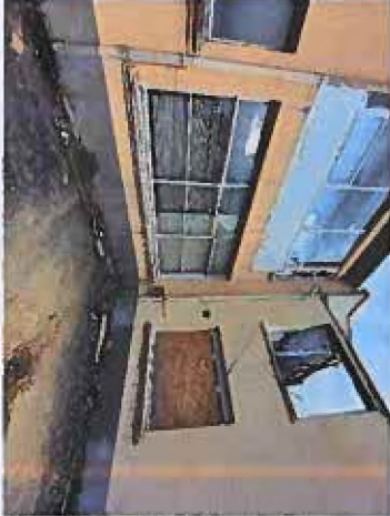
Bâtiment incendié (seule façade encore debout)