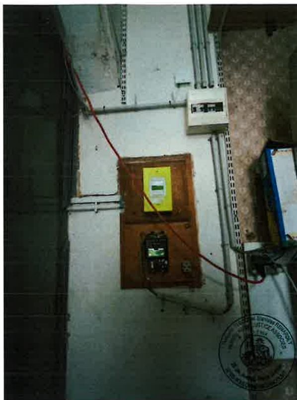
Lot 40: une cave numéro 8