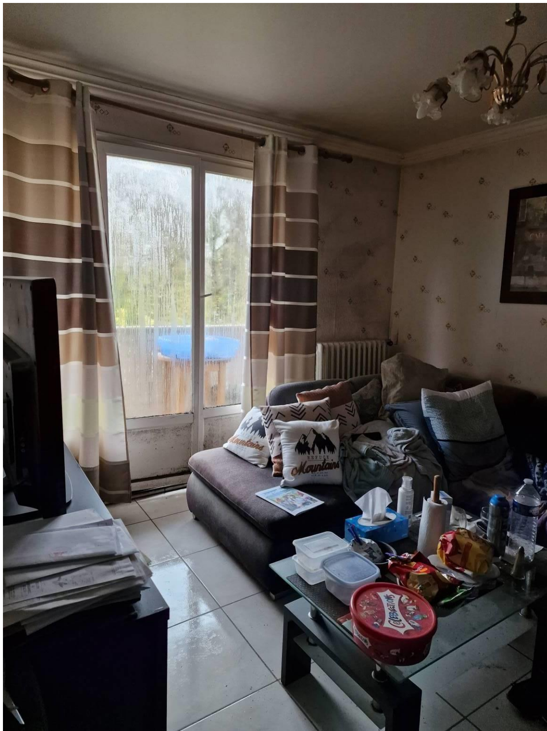
Le séjour donne sur un balcon carrelé côté façade arrière.