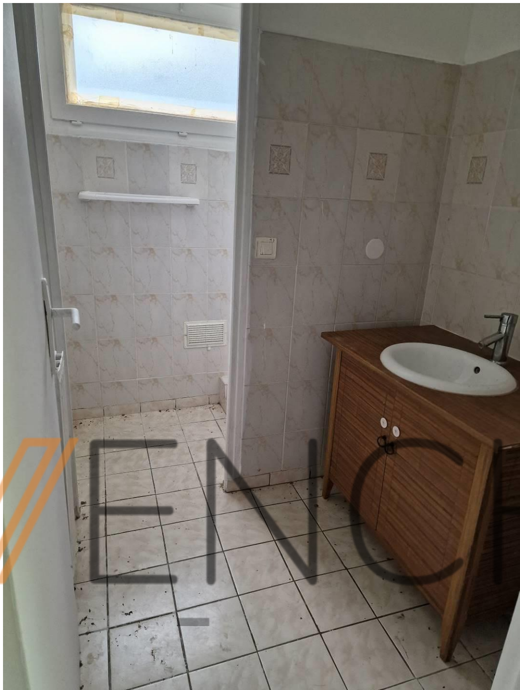
Salle de douche