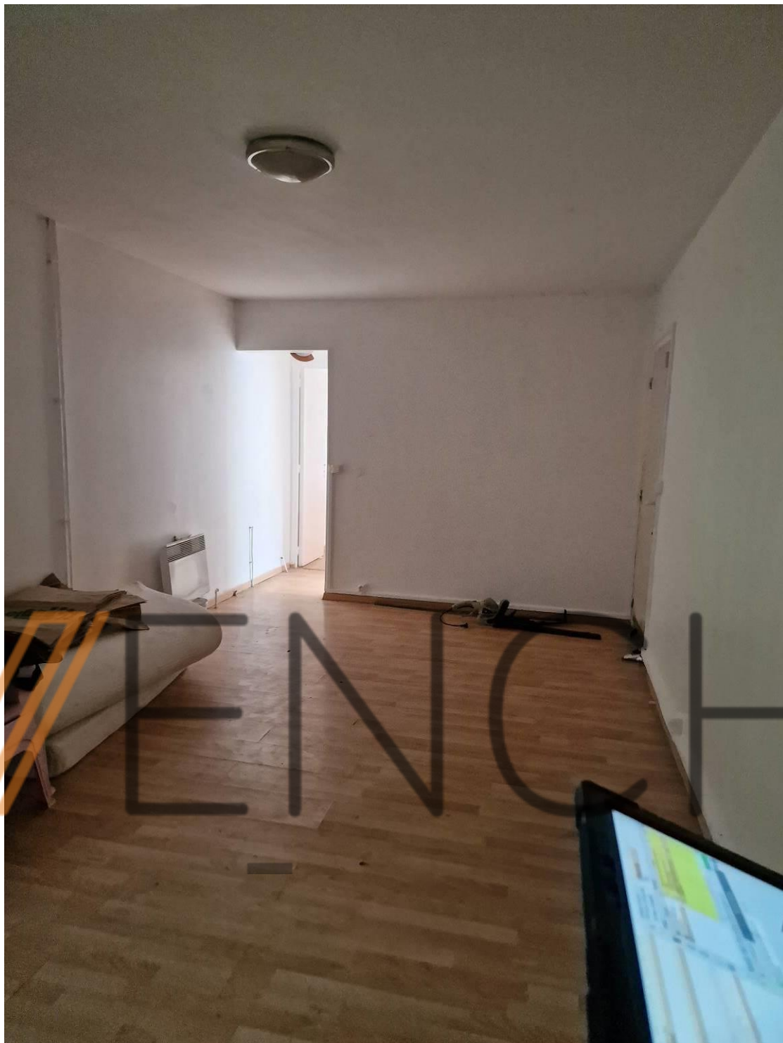
Salle de séjour