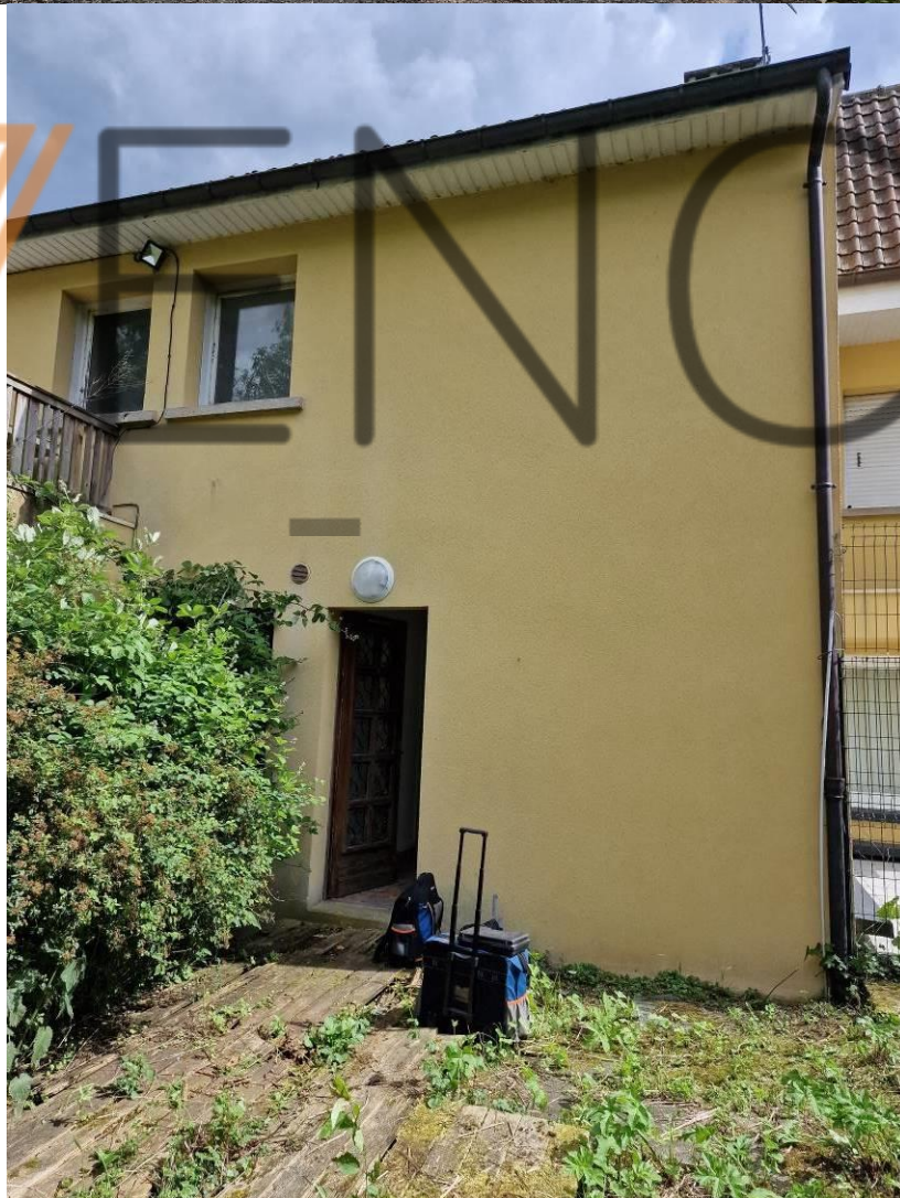
Entrée du logement en façade arrière (Nord) par le jardin