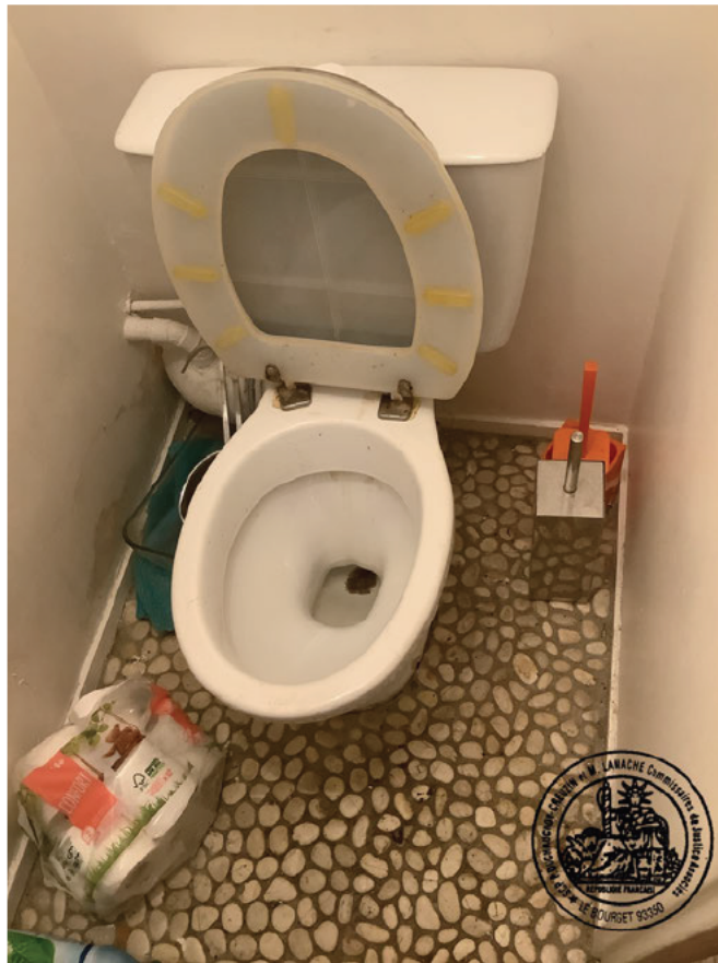
4. Cuvette WC