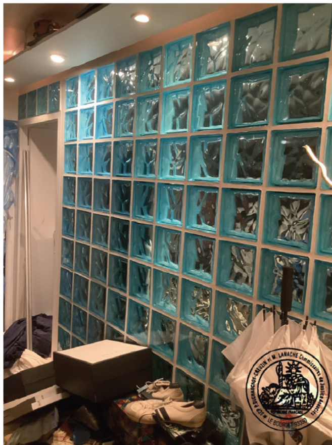
8. Cloison séparative entre le couloir et la chambre 2