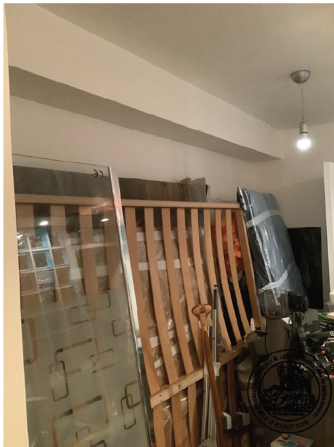
6. Ancienne salle de bains (dans le couloir)