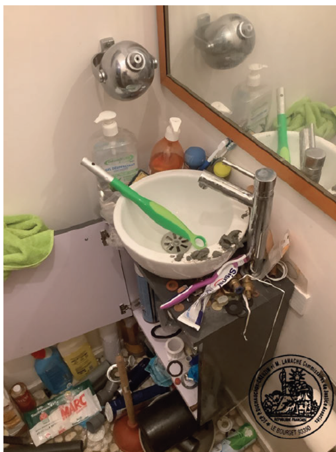
7. Lave-mains du WC