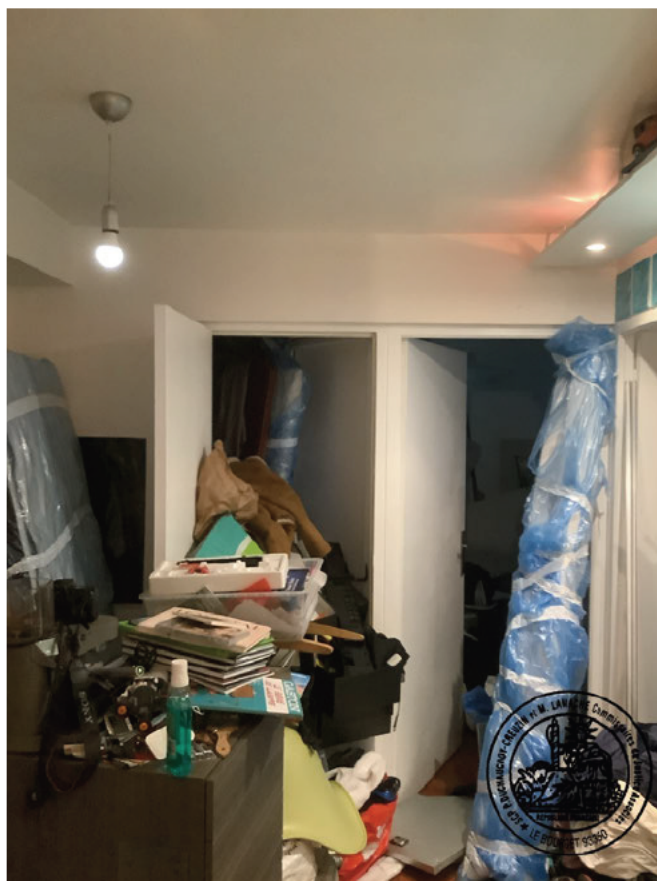
7. Débarras triangulaire à gauche et chambre 1 à droite