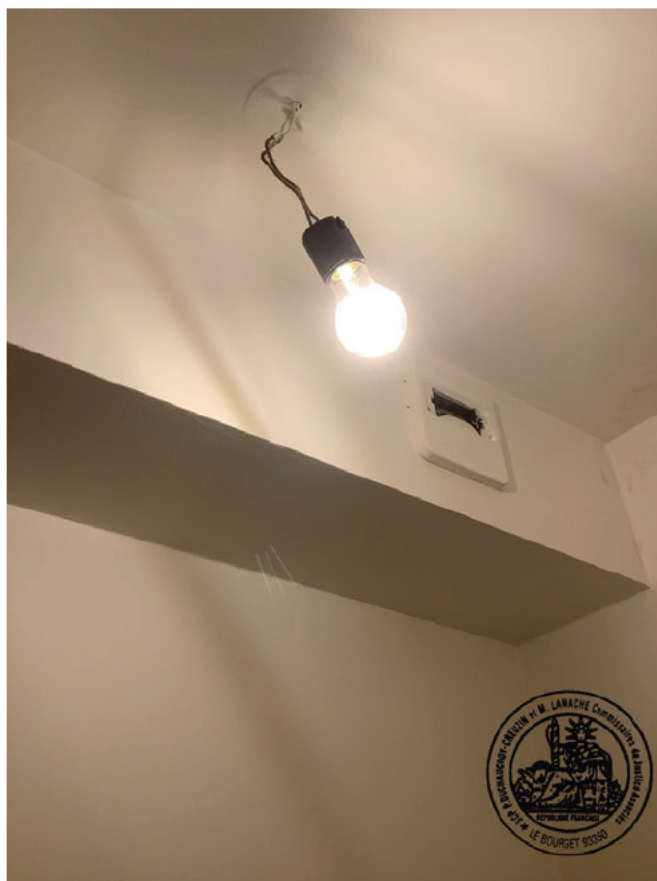
6. Plafond du WC et bouche VMC