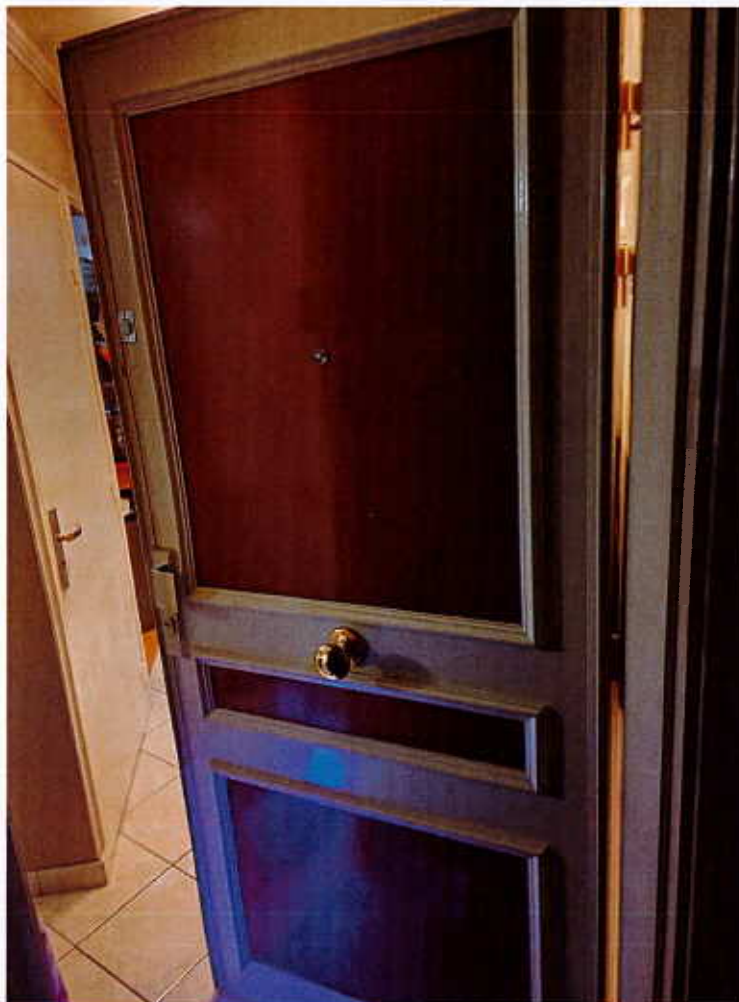
HUISSIERS PARIS-EST NOGENT Photographie n°7