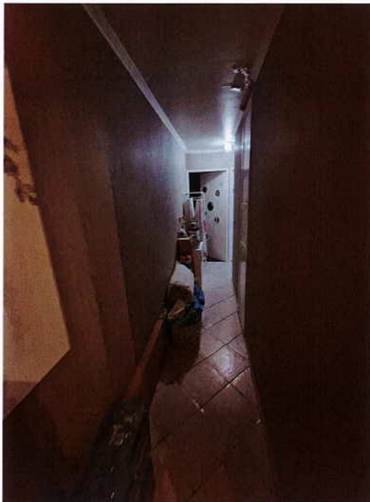
HUISSIERS PARIS-EST NOGENT Photographie n°9