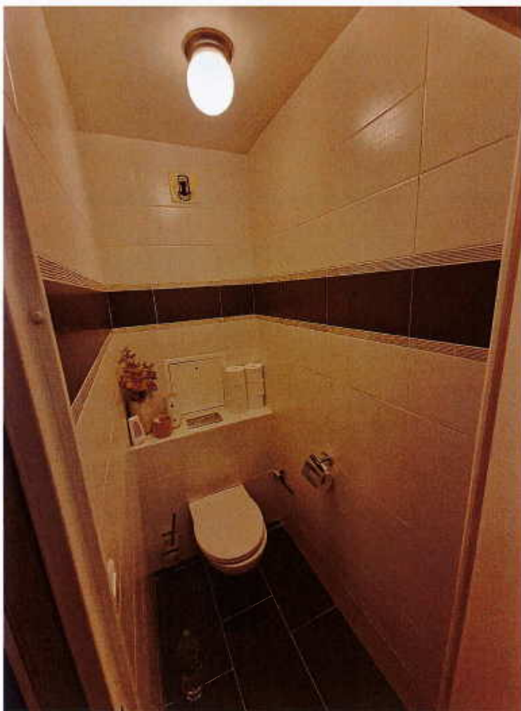
HUISSIERS PARIS-EST NOGENT Photographie n°10