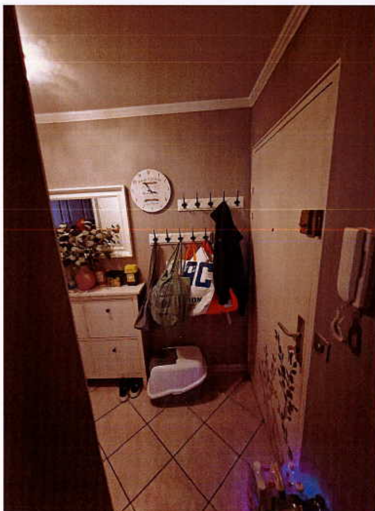
HUISSIERS PARIS-EST NOGENT Photographie n°8