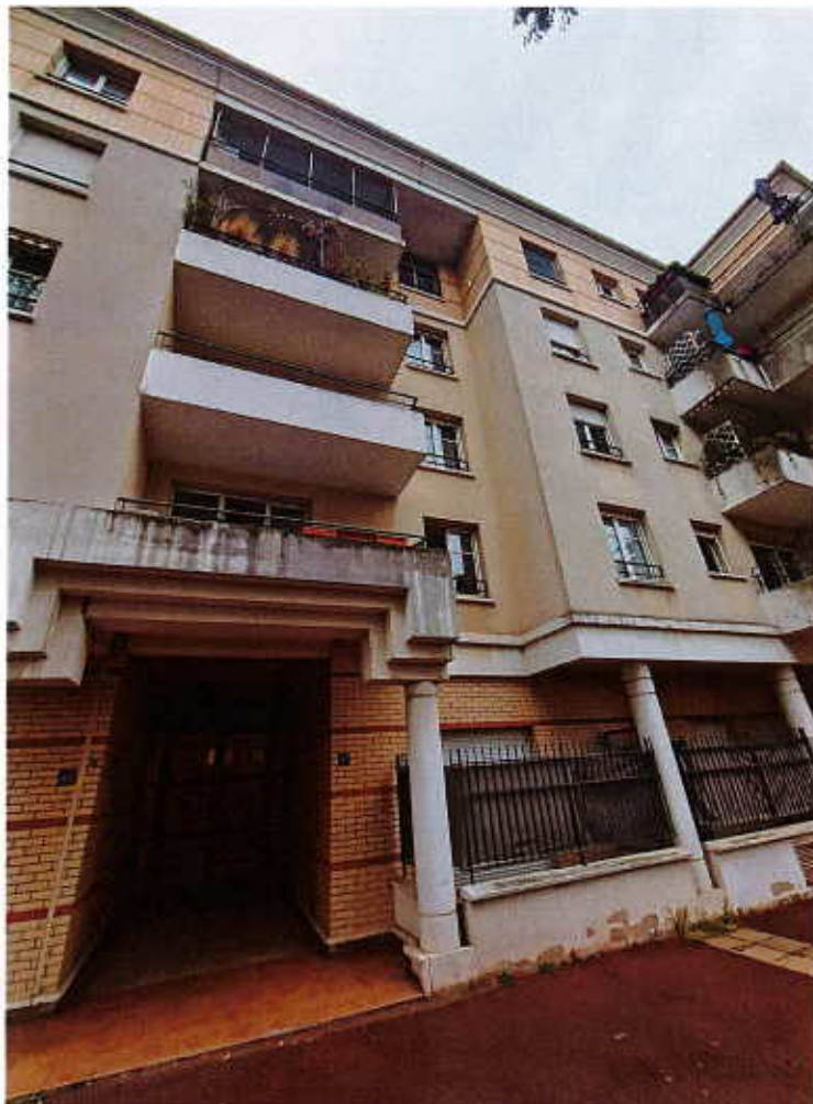
HUISSIERS PARIS-EST NOGENT Photographie n°1