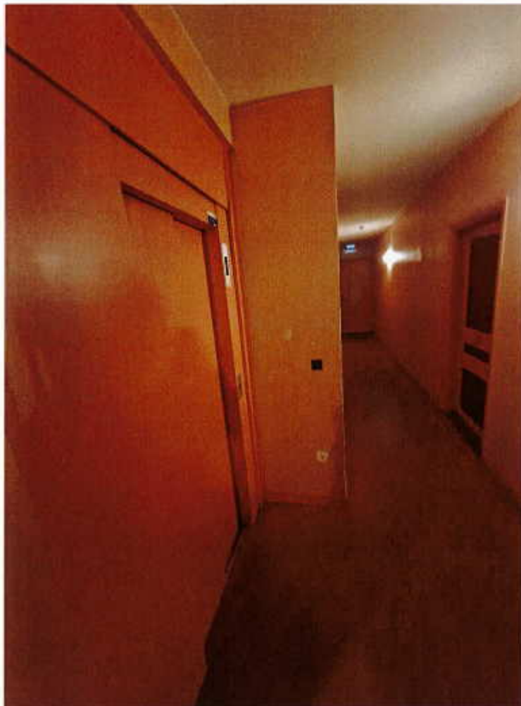
HUISSIERS PARIS-EST NOGENT Photographie n°5