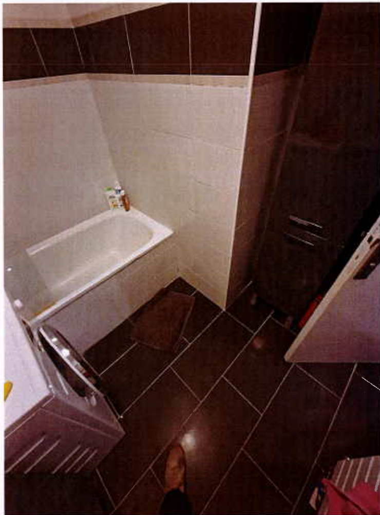
HUISSIERS PARIS-EST NOGENT Photographie n°15