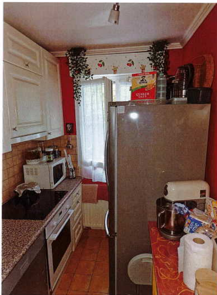
HUISSIERS PARIS-EST NOGENT Photographie n°13