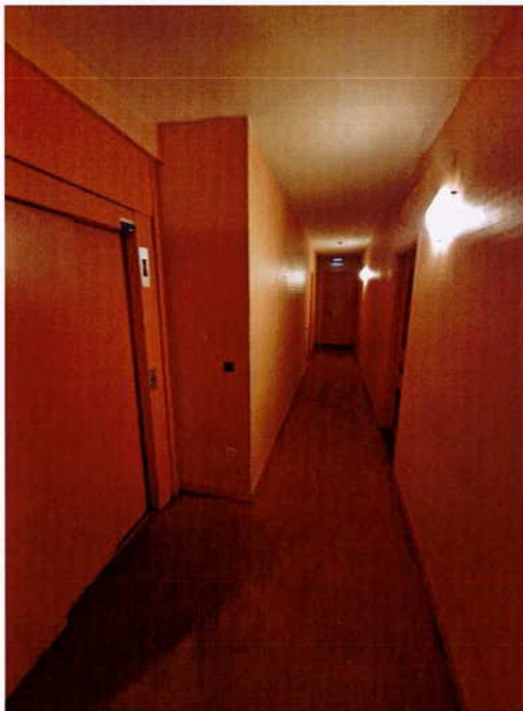
HUISSIERS PARIS-EST NOGENT Photographie n°3