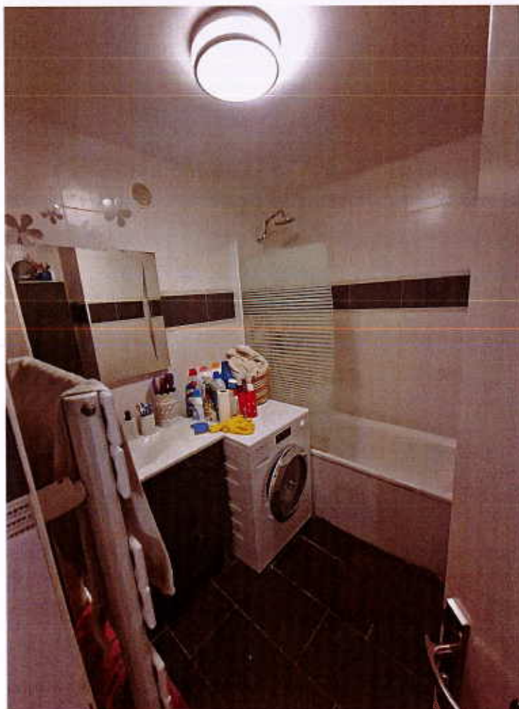
HUISSIERS PARIS-EST NOGENT Photographie n°16