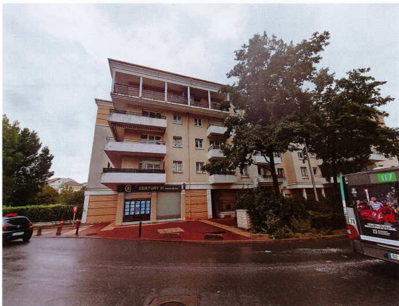
HUISSIERS PARIS-EST NOGENT Photographie n°2