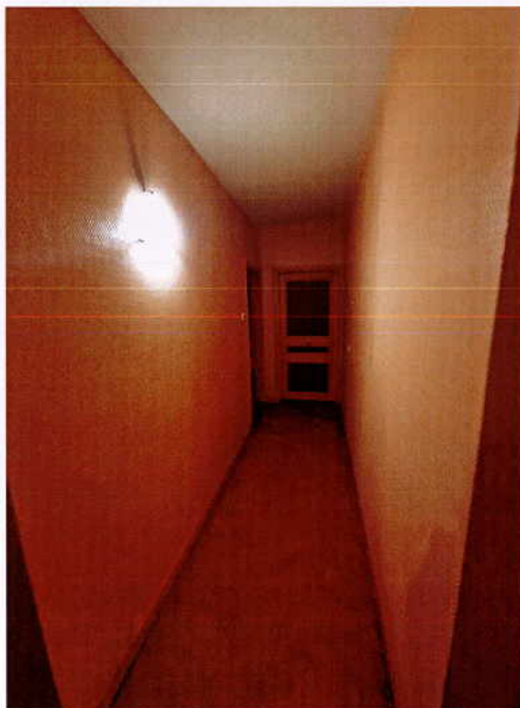
HUISSIERS PARIS-EST NOGENT Photographie n°4