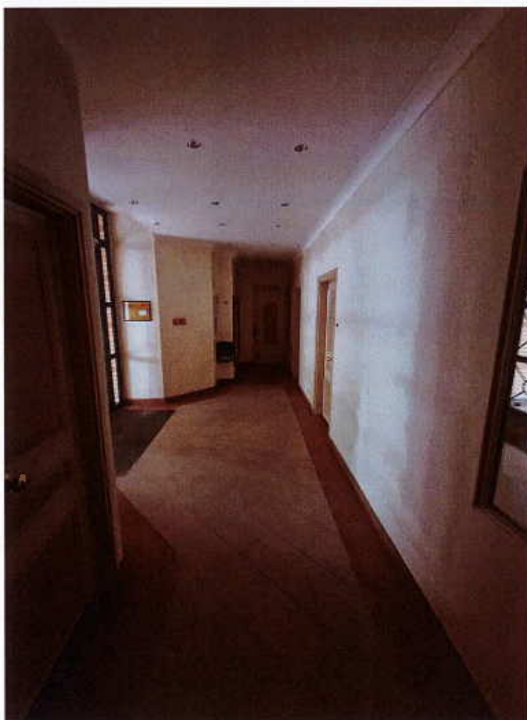
HUISSIERS PARIS-EST NOGENT Photographie n°6