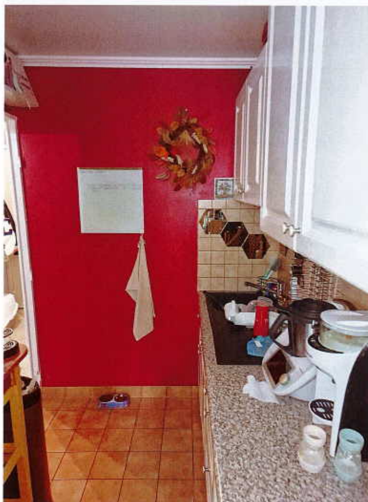
HUISSIERS PARIS-EST NOGENT Photographie n°14