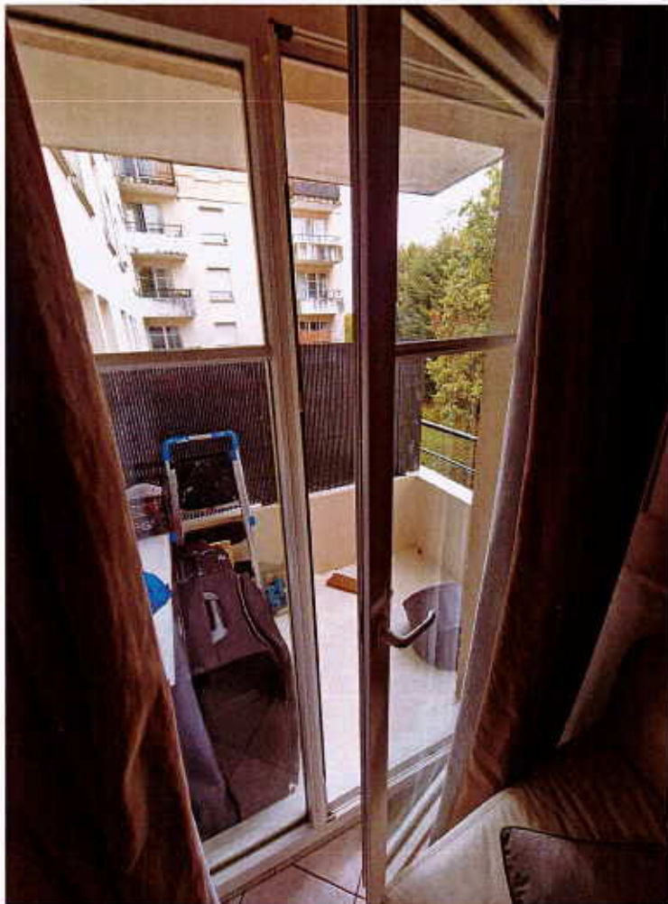
HUISSIERS PARIS-EST NOGENT Photographie n°11