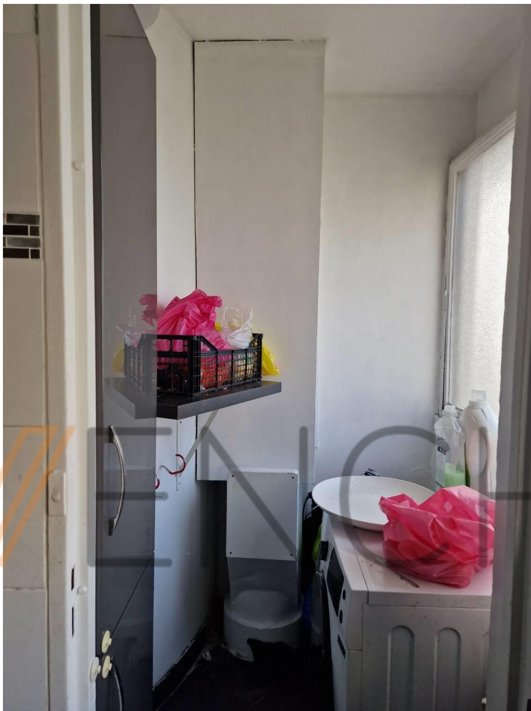
Cellier à la suite de la cuisine