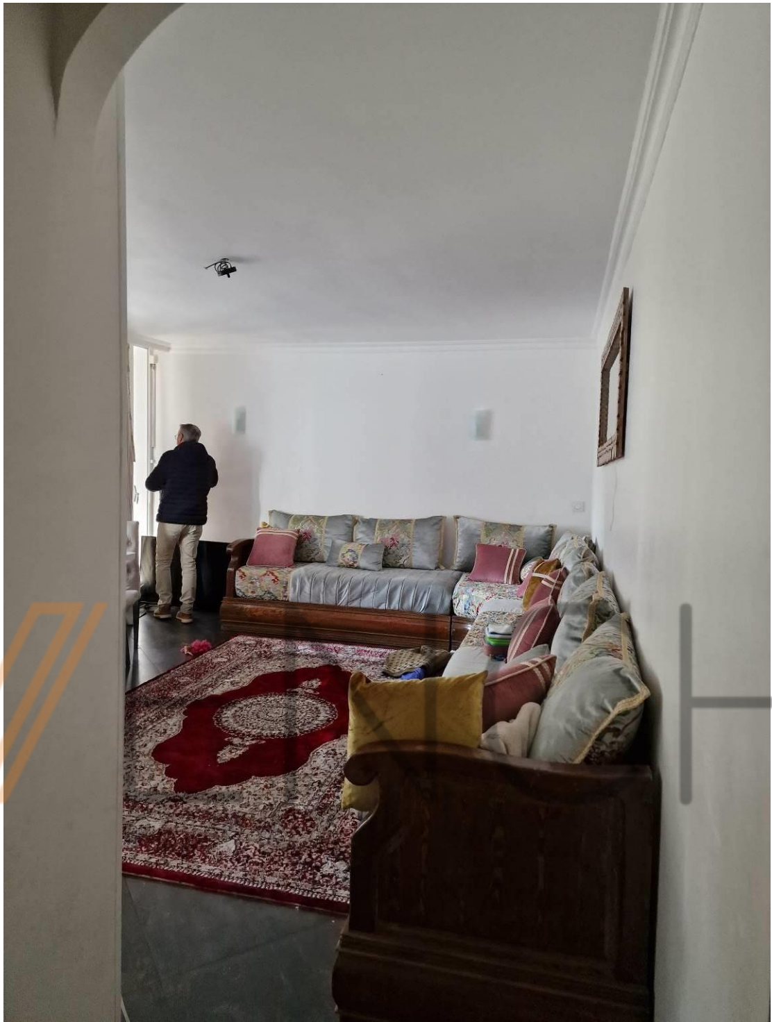
Salle de séjour