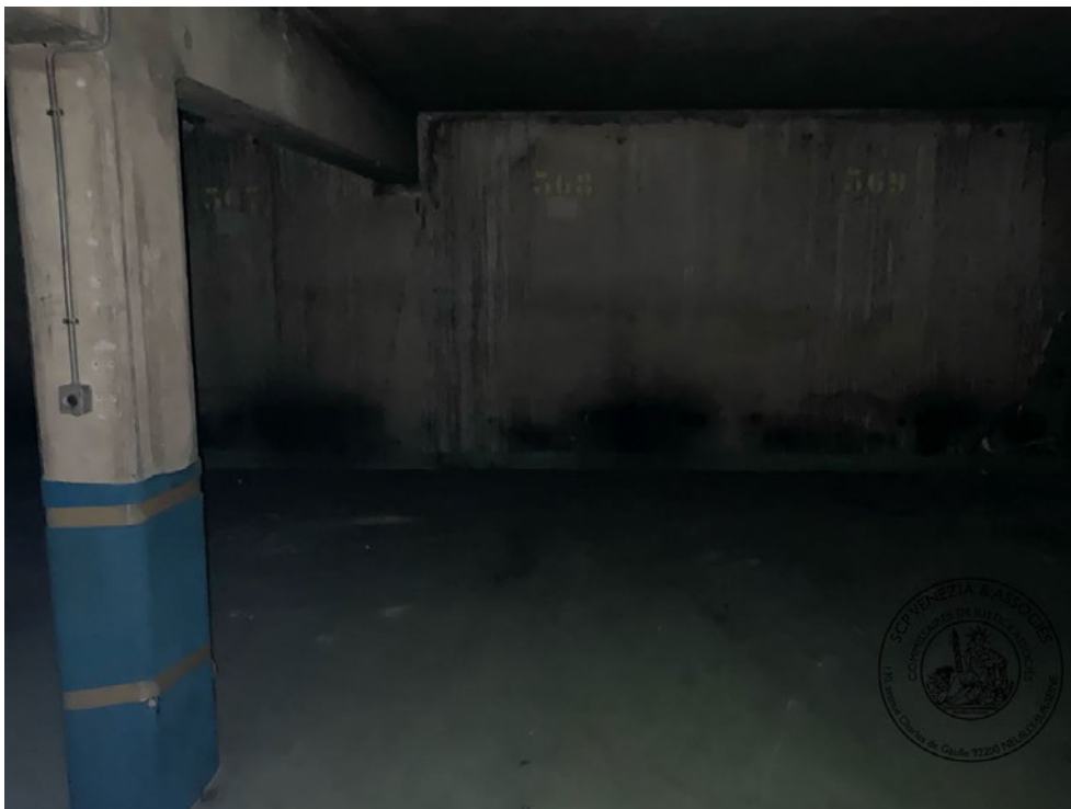
Photographie n° 7