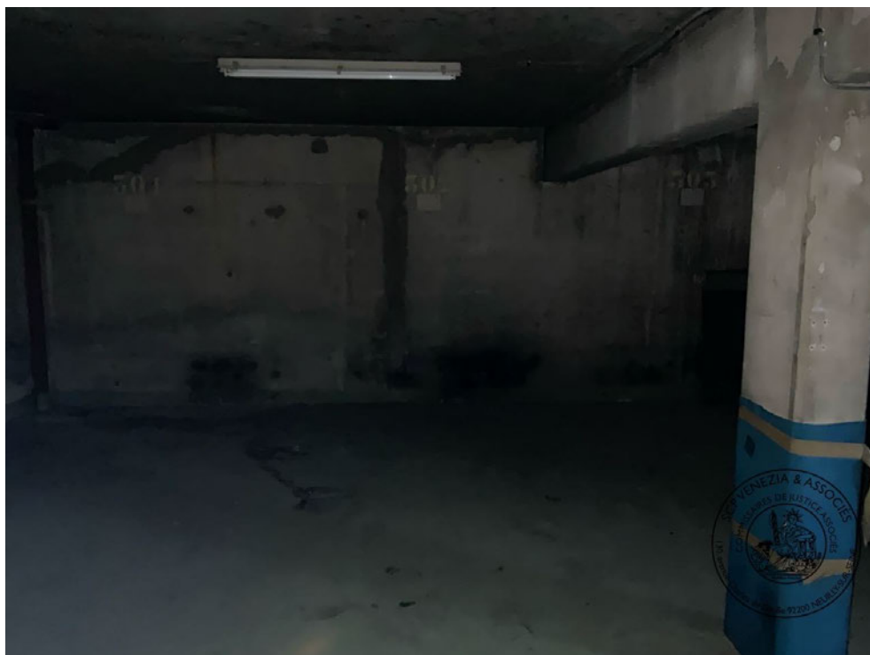
Photographie n° 2