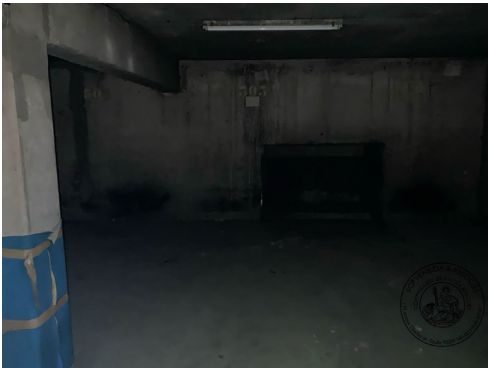
Photographie n° 3