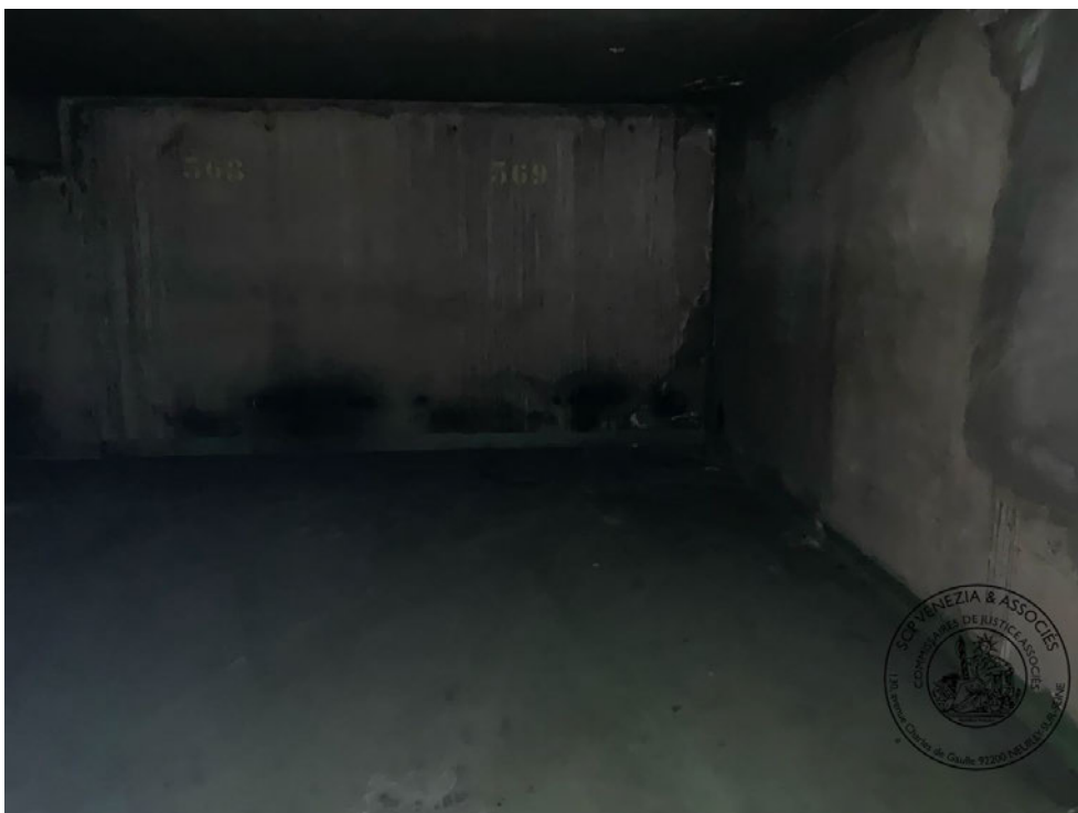
Photographie n° 8