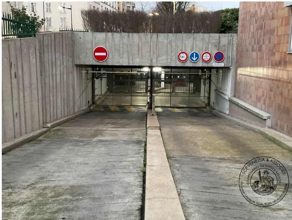
Photographie n° 1