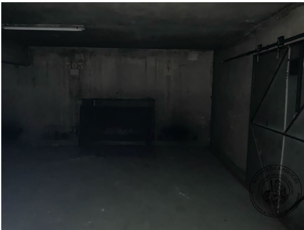
Photographie n° 4