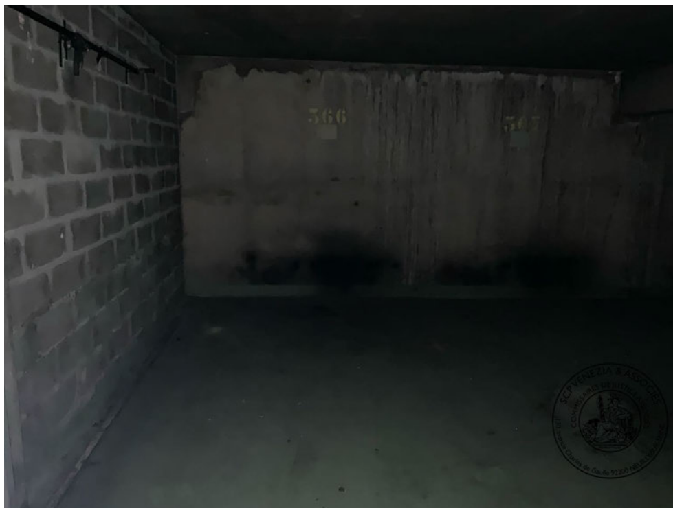
Photographie n° 5