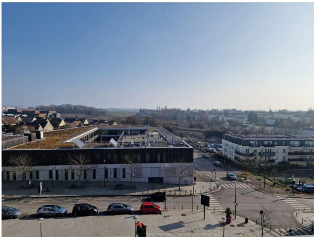
Vue de la Loggia