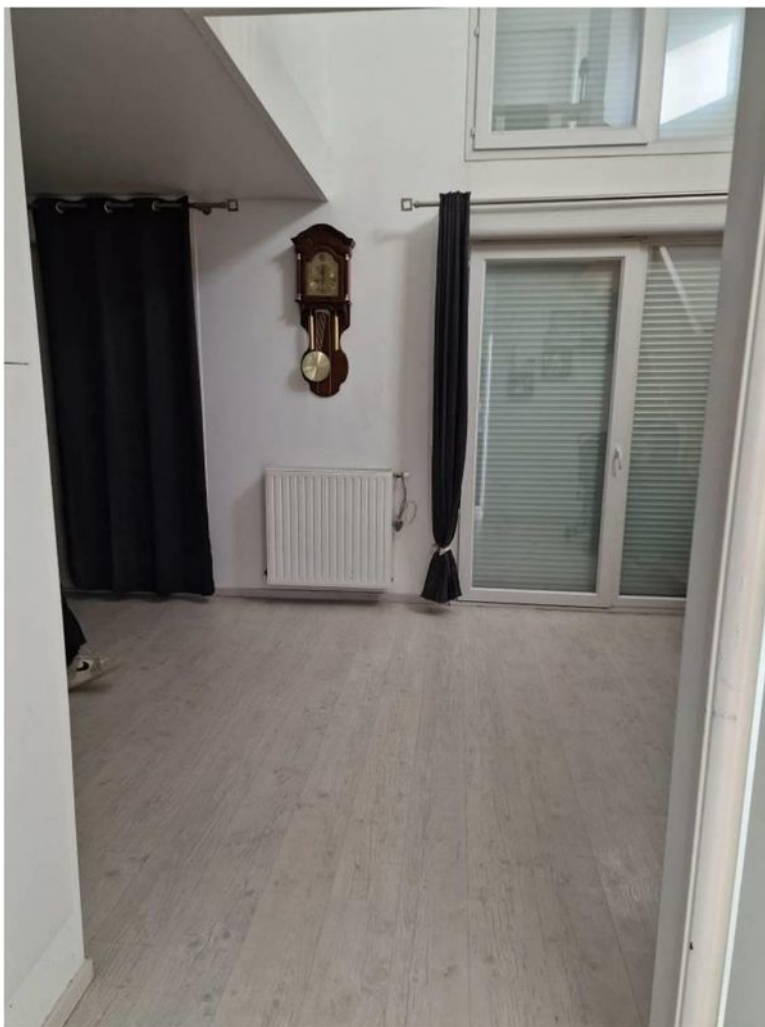
Salle de séjour