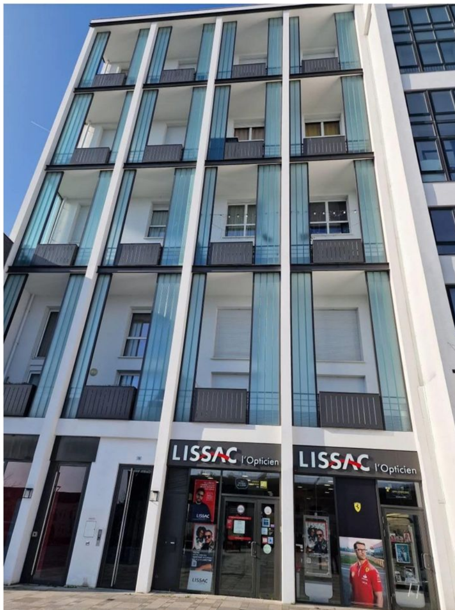
15 av Charles de Gaulle LOUVRES

Il s'agit d'un appartement n°8352 de trois pièces principales en duplex situé au 5 ème étage gauche.