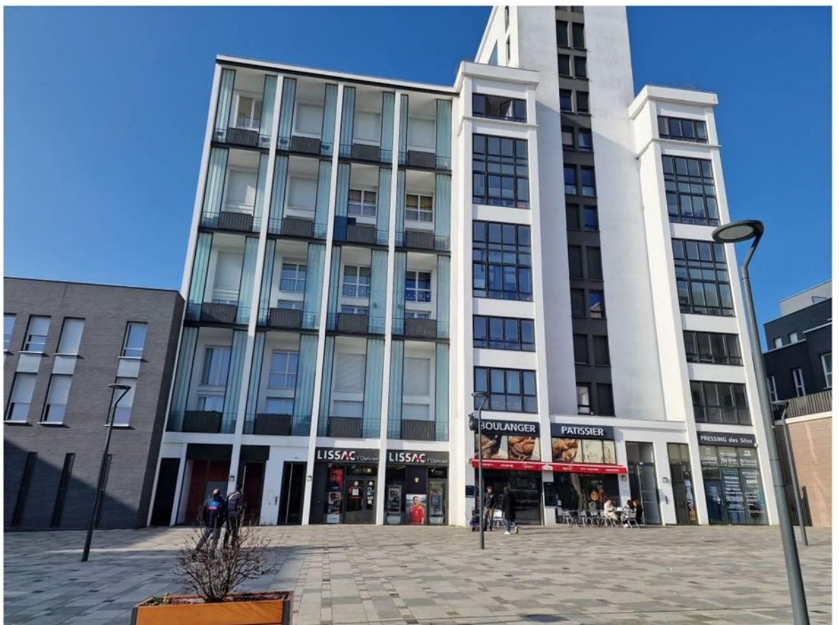
15 av Charles de Gaulle LOUVRES