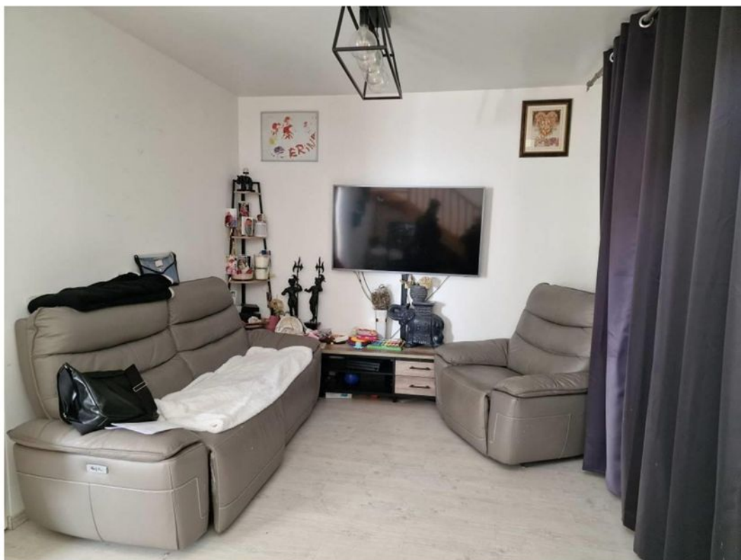
Salle de séjour