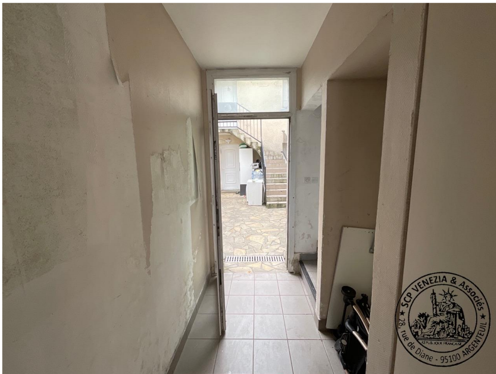
12. Couloir menant à la cour intérieure