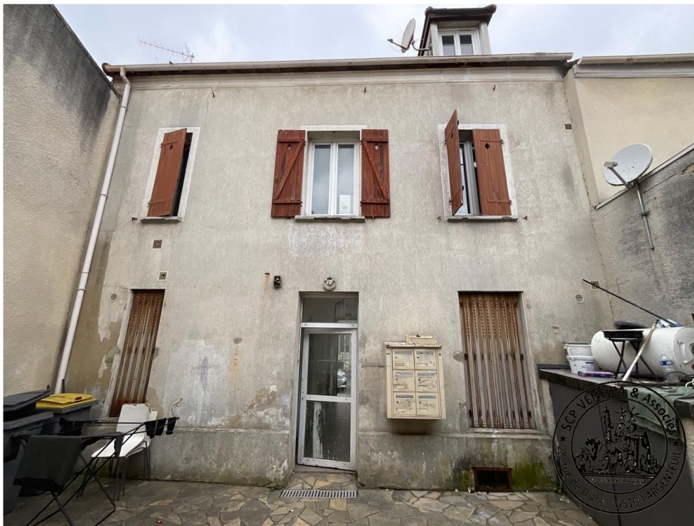
14. Façade arrière du bâtiment sur rue