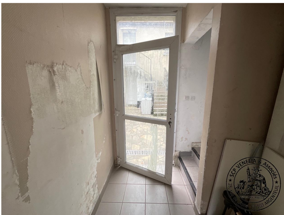
13. Couloir menant à la cour intérieure