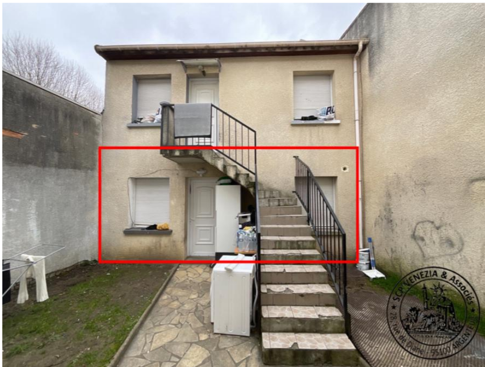
16. Emplacement du bien saisi