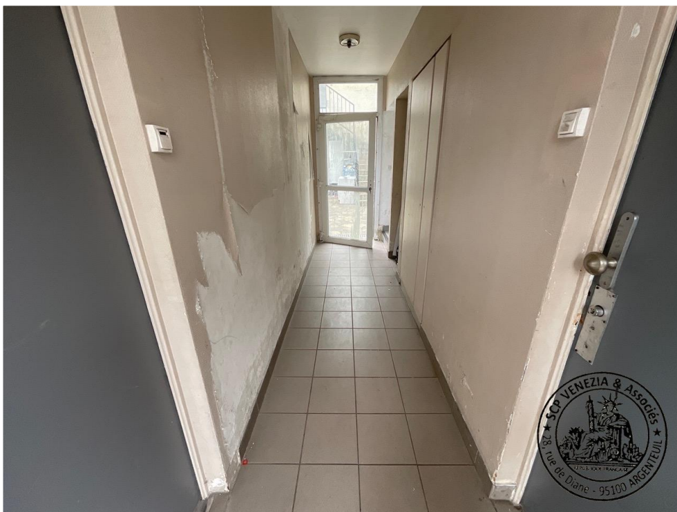
11. Couloir de l'entrée