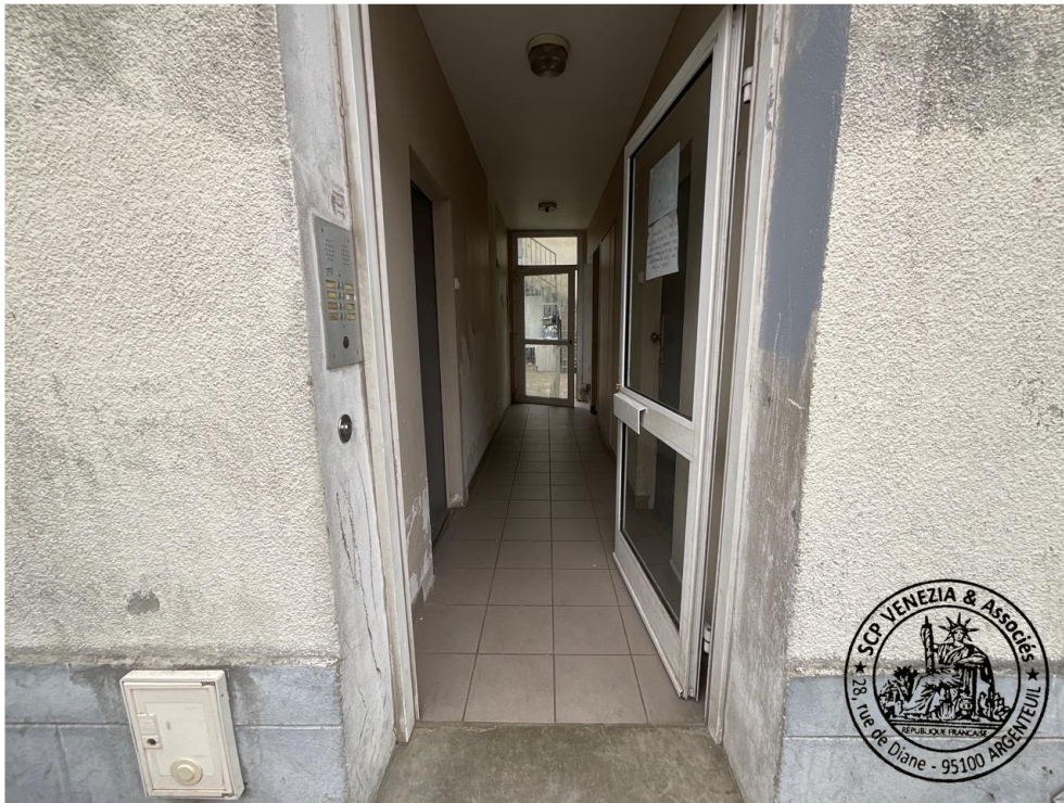
10. Entrée depuis la rue