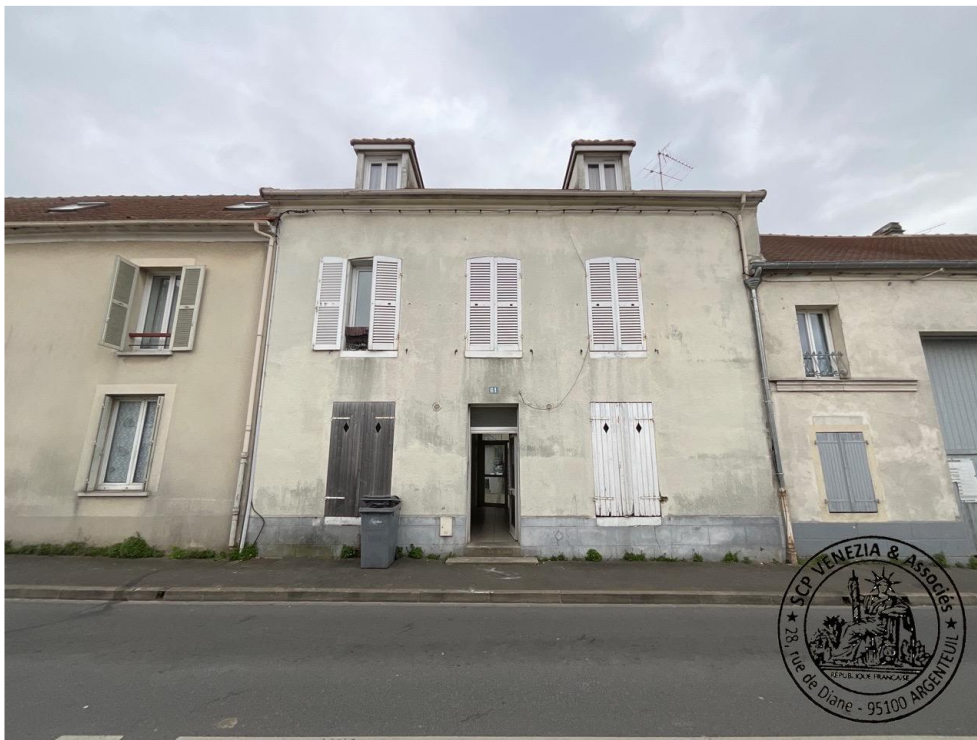
9.Façade sur rue du premier bâtiment

Le bien saisi comporte une porte d'entrée et deux fenêtres.