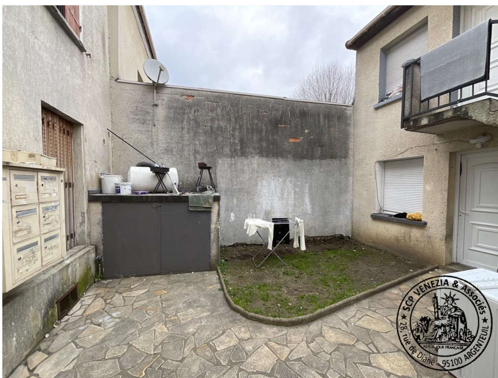
15. Cour intérieure