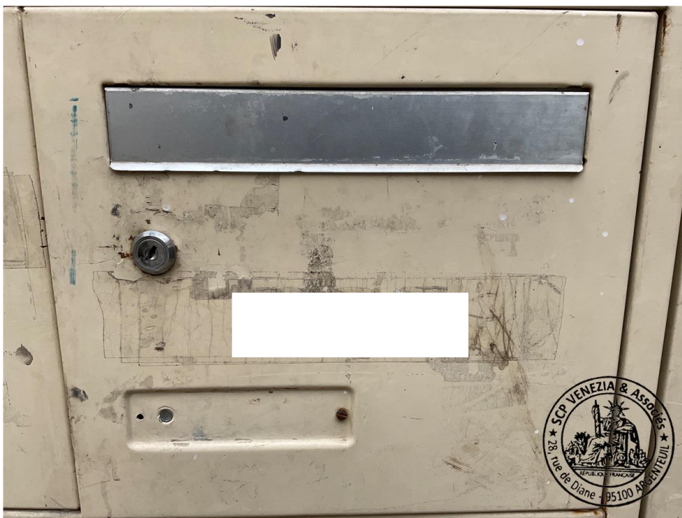
6. Boite aux lettres