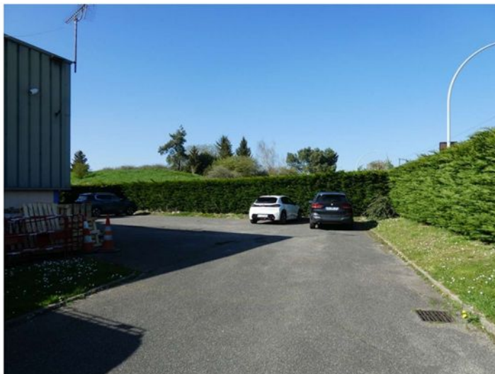
A l'arrière du bâtiment, un parking goudronné.